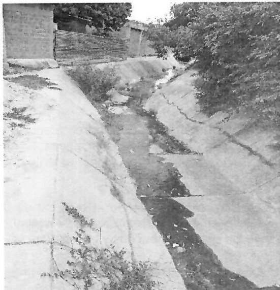
Punto de vertimiento N° 1 (Coord. Geog. Ref. 10°57.639'N - 072°47.349'O)