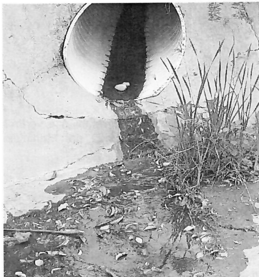
Punto de vertimiento N° 1 (Coord. Geog. Ref. 10°57.639'N - 072°47.349'O)