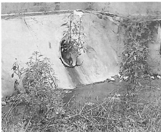
Punto de vertimiento N° 2 (Coord. Geog. Ref. 10°57.621'N - 072°47.308'O)