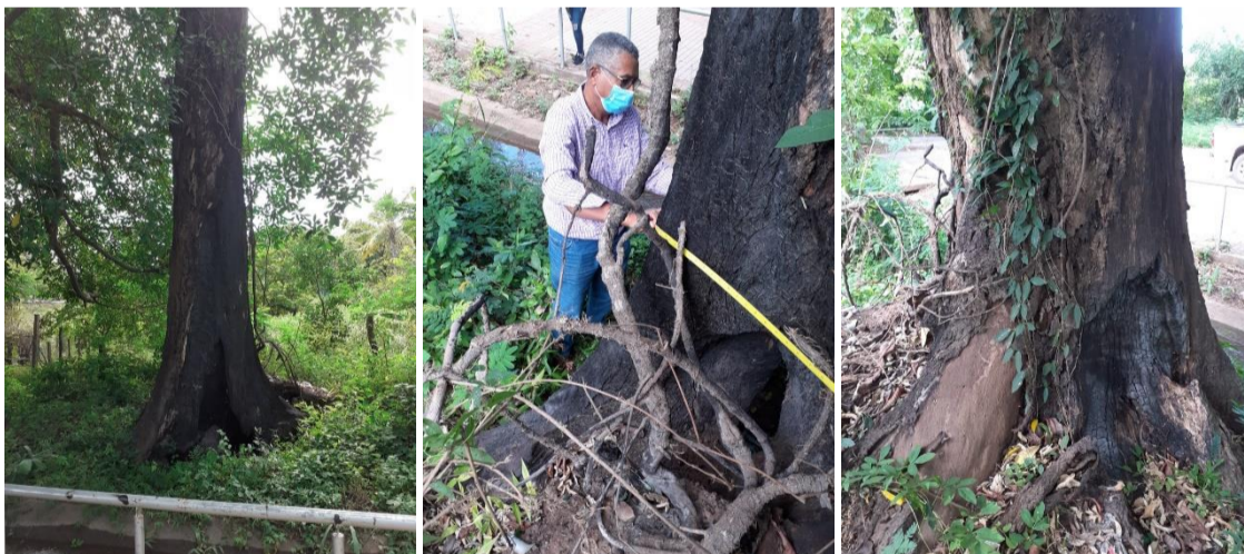
Img (2 – 4). Arbol de la especie Anacardium excelsum (Caracoli).