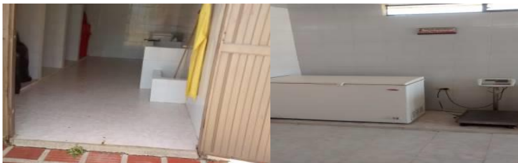
Fotografías No 1 - 2. Almacenamiento de residuos peligrosos, contenedores rojos, equipo de refrigeración para anatomopatológicos. Hospital Santa Teresa de Jesús de Ávila. 15 de febrero de 2019.