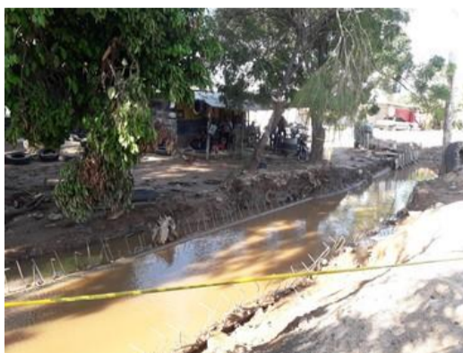
Arboles de la especie Nim No 3, 4 y 5. Sistemas radiculares debilitados.