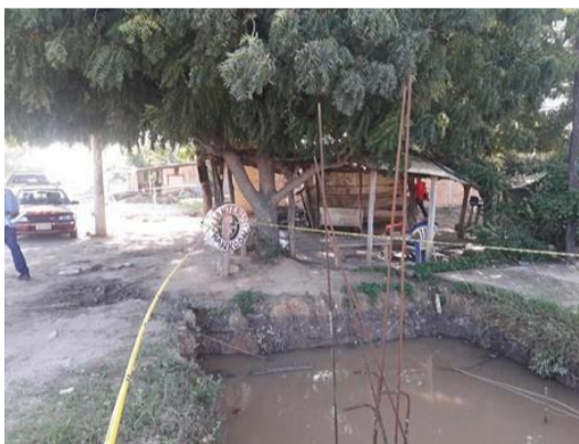
Evidencia de la necesidad de tala de los dos árboles de Nim por su ubicación.