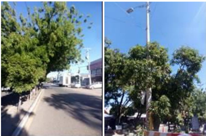
Sectores de la calle 13