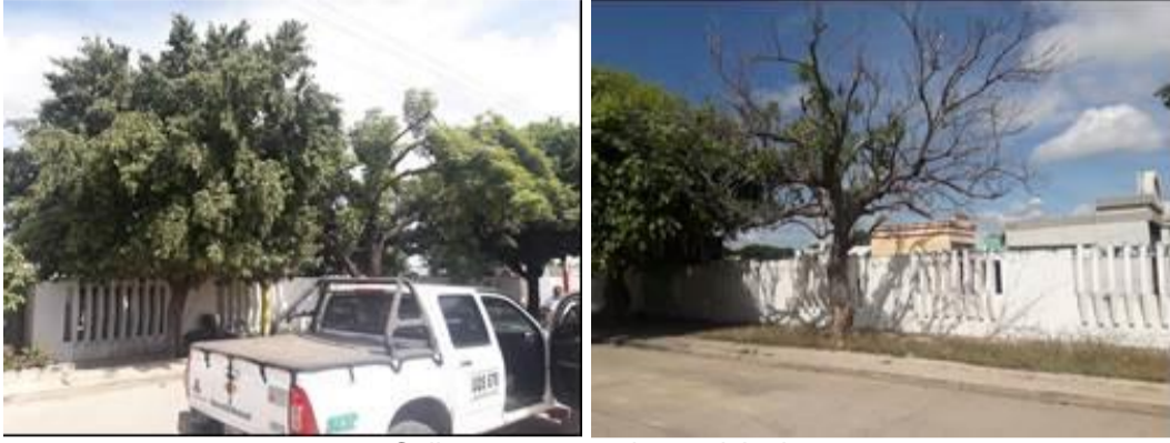
Calle 11 cementerio municipal