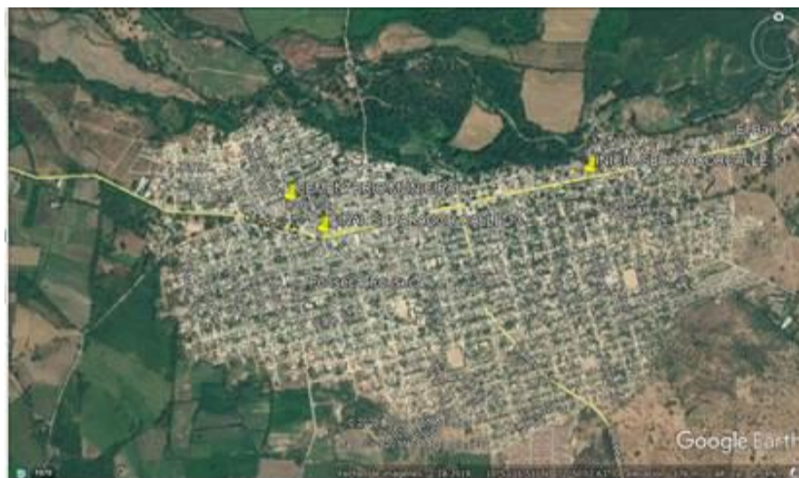
Fig. 2. Ubicación del área a intervenir.