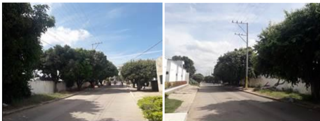
Calle 10 con carrera 21 y 22 cementerio municipal