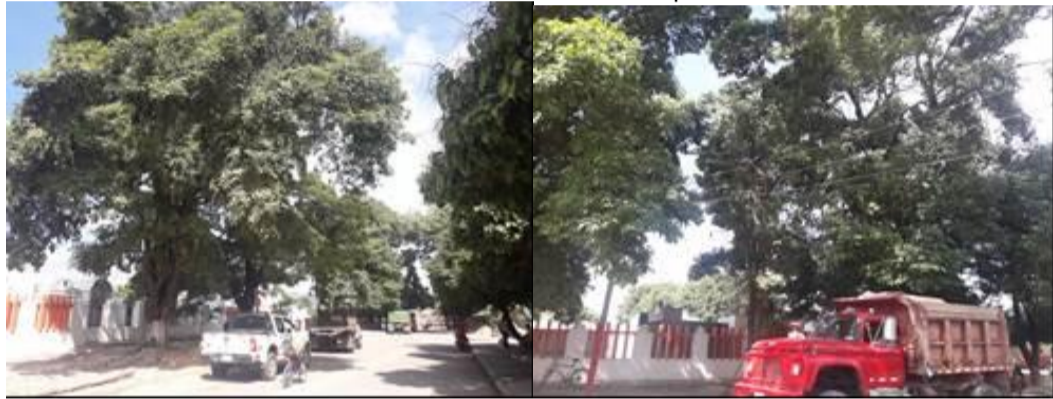
Frente del cementerio