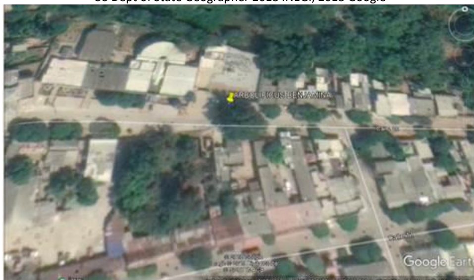
Fig. 2. Identificación de Árbol de la solicitud