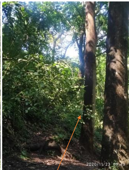
Arbol de orejo con muerte descendente