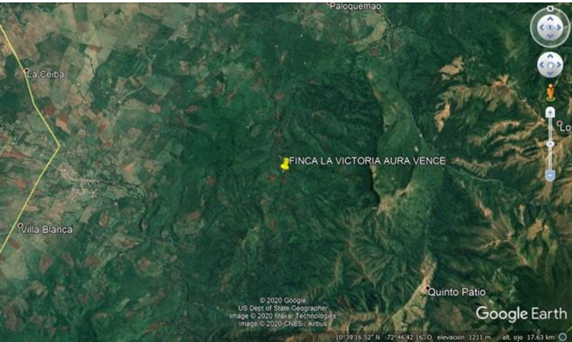
Fig. 1. Ubicación satelital de la ruta y zona de interés.