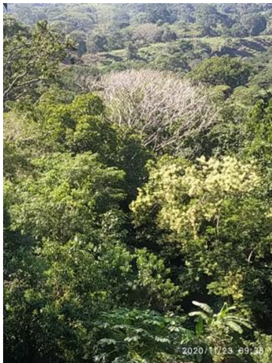
Vista del arbol desde la casa