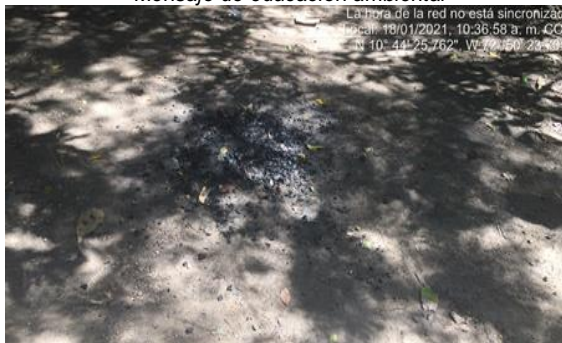
Rastros de cocción de alimentos.