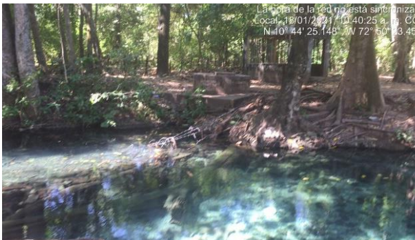
Punto de captación del acueducto