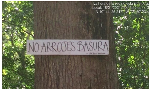
Mensaje de educación ambiental