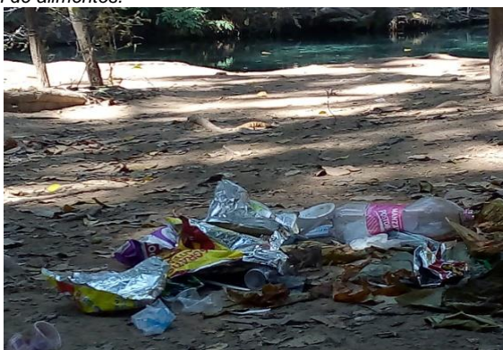
Manejo inadecuado de residuos solidos