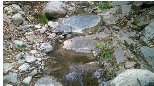
PUNTOS DE AFLORAMIENTO MANANTIAL LA CAPARROSA