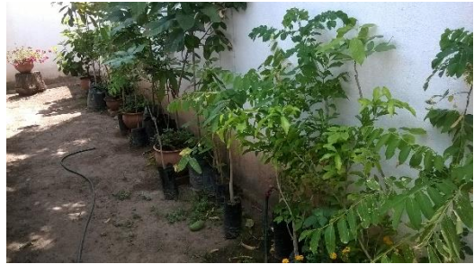
PLÁNTULAS EN EL VIVERO