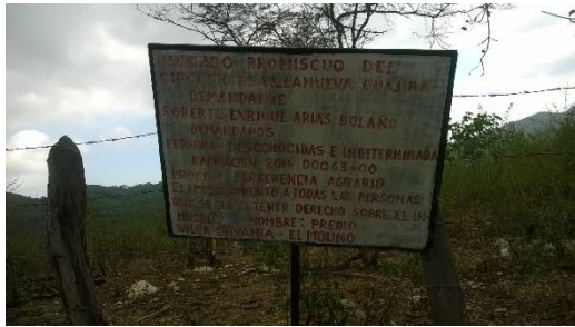
ENTRADA AL PREDIO VILLA SILVANA