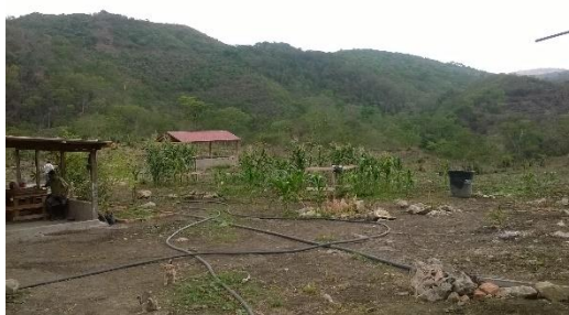
ACTIVIDADES ECONOMICAS AL INTERIOR DEL PREDIO