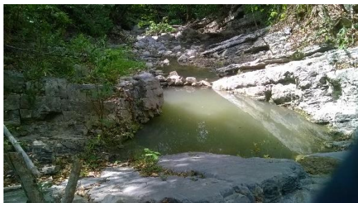
CAPTACIÓN SOBRE MANANTIAL LA CAPARROSA