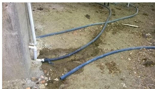
CONDUCCIÓN Y DISTRIBUCIÓN DEL SISTEMA