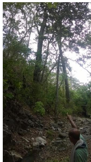
ZONA DE RESERVA