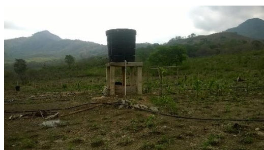
TANQUES DE ALMACENAMIENTO