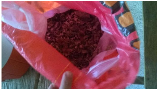
SEMILLAS FORESTALES PARA REPRODUCCIÓN DE LA ESPECIE