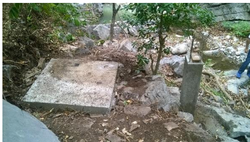
PLACA BASE Y COLUMNA EN CONCRETO REFORZADO_CAPTACIÓN