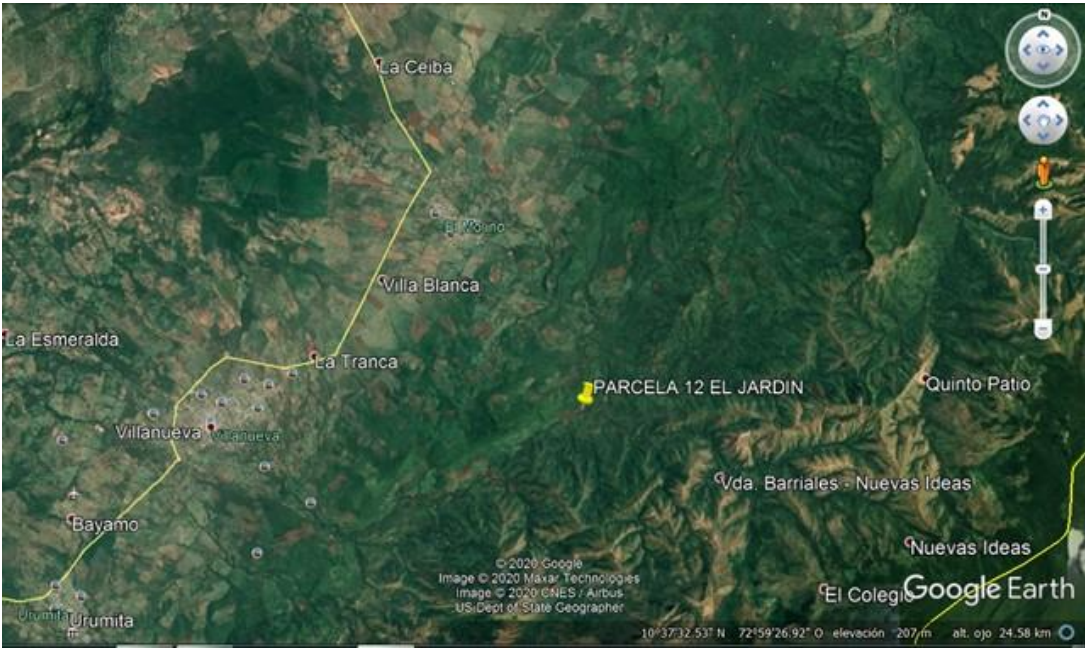
Fig. 1. Ubicación satelital de la ruta y zona de interés.