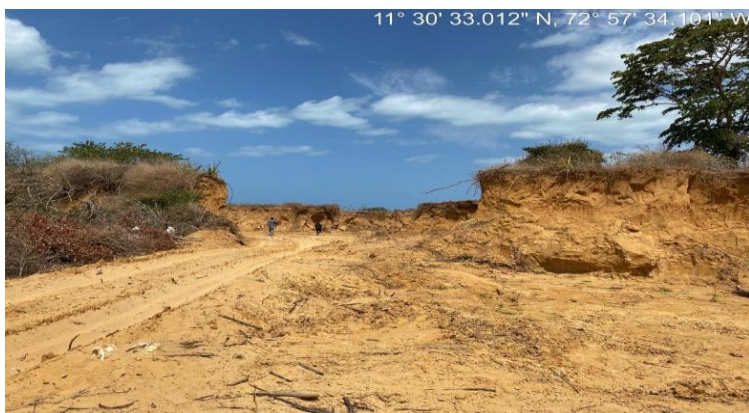
Foto 5. Área visitada, ruptura de pequeña colina para el ingreso de vehículos al área de extracción