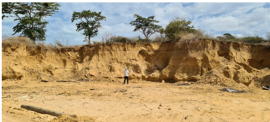
Foto 3. Panorámica del Área visitada, nótese la altura del corte