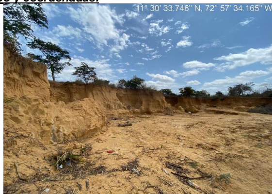
Foto 2. Área de extracción de arena