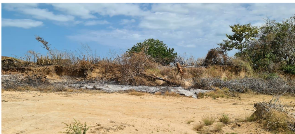
Foto 4. Área visitada, cobertura vegetal intervenida