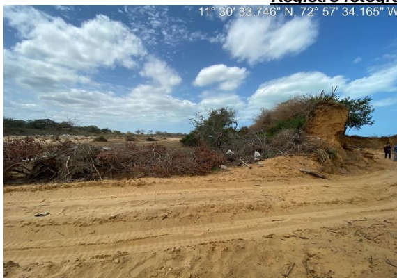
Foto 1. Cobertura vegetal intervenida