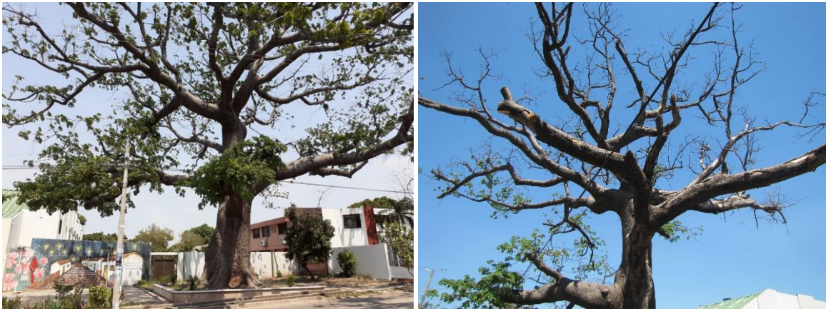
Img.6. Fotografia 09 de marzo del 2020