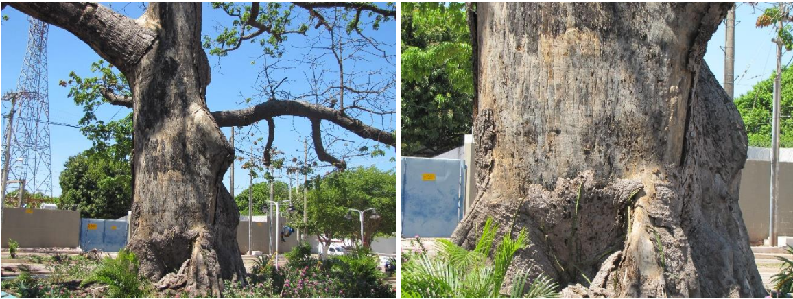
Img. (2 – 3). Descortezado del Fuste del arbol de Ceiba