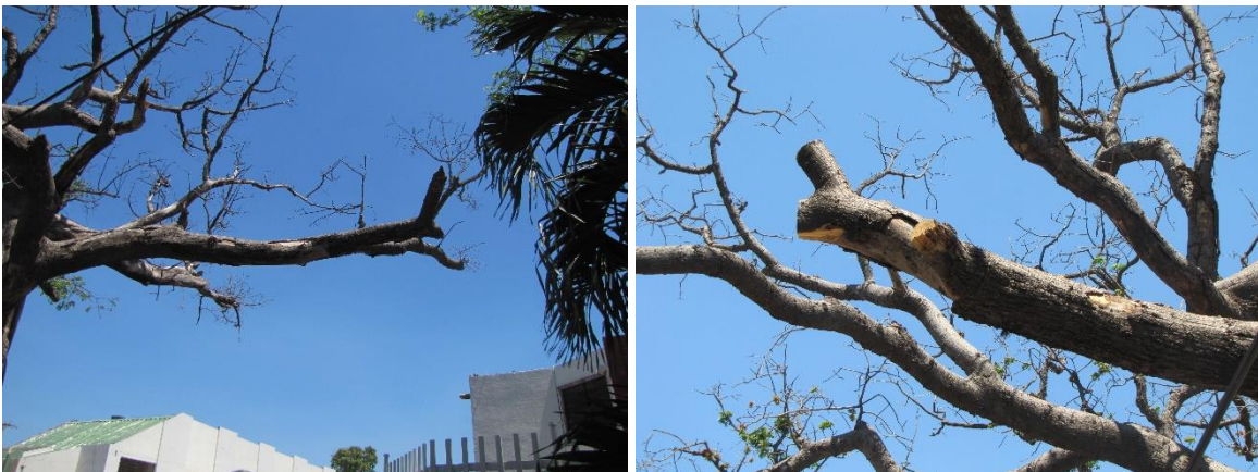
Img. (4 – 5). Alto grado de defoliacion en las ramas de la Ceiba