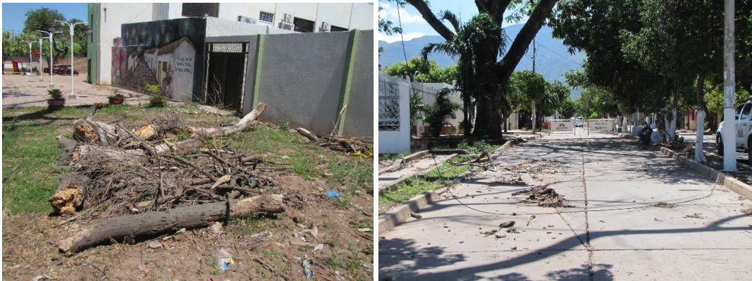
Img.(8 – 9). Perdida diaria del material vegetal que se desprende del arbol.

En la imagen 8 y 9 se logra a preciar la pérdida constante de material vegetal del árbol, en la foto 9 se hace evidente la presencia de mayas cerrando la calle, esto se hizo necesario debido a la gravedad que representa dicho árbol para los transeuntes que circundan por este sector.