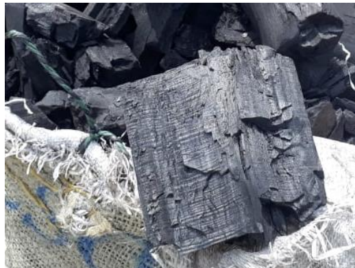
Imagen 2 Material incautado