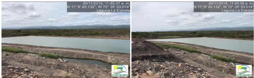
Fotografías No. 3 y 4. Estado de la Laguna La Estrella. CARBONES DEL CERREJON LIMITED – CERREJON. COMPLEJO MINA. 29 de noviembre de 2019.