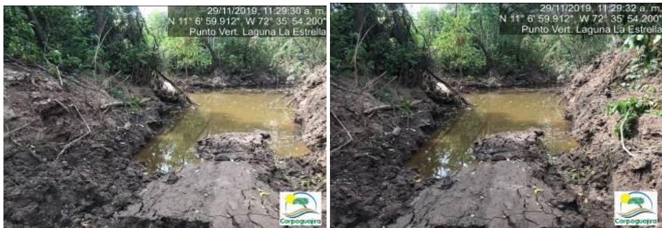
Fotografías No. 5 y 6. Punto de vertimiento de aguas Laguna La Estrella. CARBONES DEL CERREJON LIMITED – CERREJON. COMPLEJO MINA. 29 de noviembre de 2019. (Fuente: Corpoguajira 2019).

En las siguientes fotografías, se muestra el estado del Punto de Vertimiento de las aguas procedentes de la Laguna La Estrella en el Arroyo Tabaco.