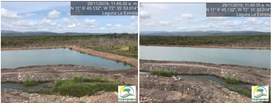
Fotografías No. 1 y 2. Estado de la Laguna La Estrella. CARBONES DEL CERREJON LIMITED – CERREJON. COMPLEJO MINA. 29 de noviembre de 2019.

Correspondiente al estado de la laguna, se manifiesta que la Laguna La Estrella se encuentra construida en su totalidad, en el momento de la visita se evidencio que la laguna contenía aguas procedentes del Botadero La Estrella, esta laguna no cuenta con la construcción de un vertedero para que las aguas salgan de su interior, se manifestó por parte de los empleados de la empresa Cerrejón que esta laguna se encuentra intercomunicada por tubería con el Embalse 3, esto con la finalidad de manejar el almacenamiento de agua de esta laguna.