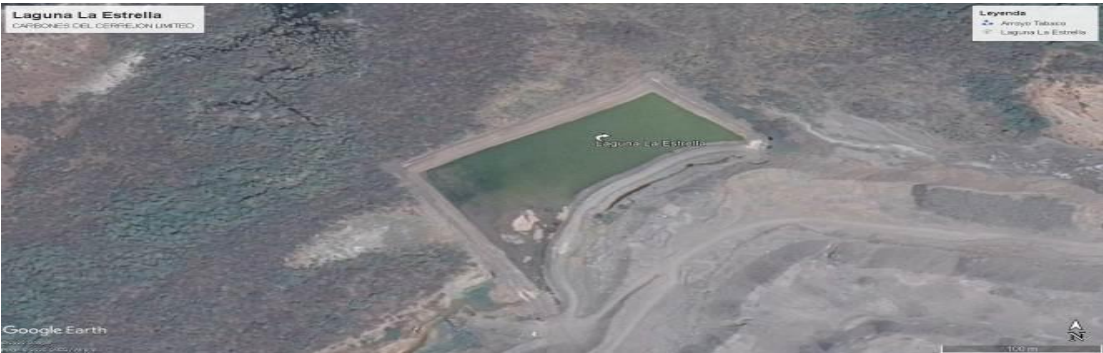
Imagen No. 1. Ubicación Geográfica de la Laguna La Estrella. CARBONES DEL CERREJON LIMITED – CERREJON. COMPLEJO MINA. 29 de noviembre de 2019..

Esta Laguna se encuentra construida, en la actualidad contiene las aguas de escorrentías provenientes del Botadero La Estrella, esta laguna se encuentra interconectada con el Embalse 3 para realizar el balance de agua. Esta laguna cuenta con una construcción de forma rectangular alargada en dos esquinas, además tendrá una capacidad de 56.000 m 3 del cual, del cual un 10% será ocupado por los sedimentos que se irán acumulando. Esta laguna hará vertimiento en el Arroyo Tabaco.