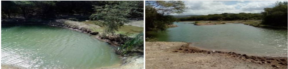
Fotografías No. 1 y 2. Estado de la Laguna Palmarito. CARBONES DEL CERREJON LIMITED – CERREJON. COMPLEJO MINA. 28 de noviembre de 2019. (Fuente: Corpoguajira 2019).

La empresa, en la Laguna Palmarito no ha iniciado las labores de adecuación de dicha laguna, la capacidad que manifiesta el permiso de vertimiento, no corresponde la capacidad actual de la laguna, con la manifestada en dicho permiso, también carece de las condiciones adecuadas y planteadas en el precitado permiso.