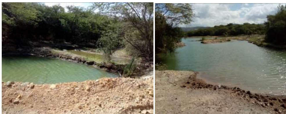
Fotografías No. 3 y 4. Estado de la Laguna Palmarito. CARBONES DEL CERREJÓN LIMITED – CERREJÓN. COMPLEJO MINA. 28 de noviembre de 2019. (Fuente: Corpoguajira 2019).