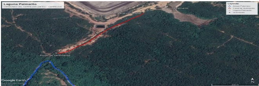
Imagen No. 1. Ubicación Geográfica de la Laguna Palmarito. CARBONES DEL CERREJON LIMITED – CERREJON. COMPLEJO MINA. 28 de noviembre de 2019. (Fuente: Google Earth 2019).

Esta Laguna no se encuentra construida, existe un pequeño reservorio donde se estancan las aguas procedentes del Botadero Palmarito. Esta laguna tendrá una capacidad de 25.600 m³ del cual, un 5% correspondiente a los depósitos de sedimentos que se van acumulando. Esta laguna hará vertimiento en el Arroyo Palomino.