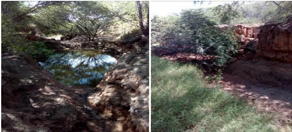
Fotografías No. 9 y 10. Canal de vertimiento de aguas Laguna Palmarito. CARBONES DEL CERREJON LIMITED – CERREJON. COMPLEJO MINA. 28 de noviembre de 2019.

A continuación se procede a evidenciar el cumplimiento de las obligaciones impuestas por Corpoguajira a la empresa CARBONES DEL CERREJÓN LIMITED – CERREJÓN mediante la Resolución No. 1956 del 30 de agosto de 2018, que otorgó el permiso de vertimiento al Arroyo Palomino procedente de la Laguna Palmarito, dicho acto administrativo en su Artículo Cuarto establece que la empresa en mención deberá dar estricto cumplimiento a todas las medidas establecidas en la parte emotiva del acto administrativo, normatividad ambiental vigente e igualmente a todas aquellas solicitudes que surjan de las actividades de seguimiento ambiental por parte de la autoridad competente: