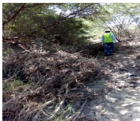
Fotografías No. 5 y 6. Canal de vertimiento de aguas Laguna Palmarito. CARBONES DEL CERREJÓN LIMITED – CERREJÓN. COMPLEJO MINA. 28 de noviembre de 2019.