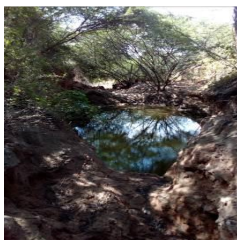
Fotografías No. 7 y 8. Canal de vertimiento de aguas Laguna Palmarito. CARBONES DEL CERREJÓN LIMITED – CERREJÓN. COMPLEJO MINA. 28 de noviembre de 2019.