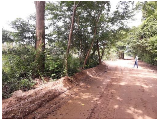
Arboles No. 7, 8 y 9