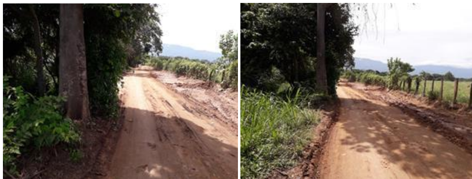
Arbol No. 13