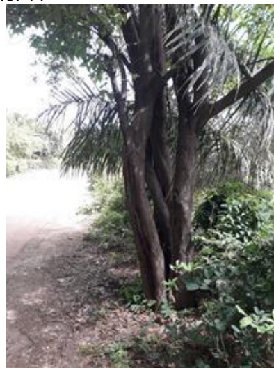
Arbol No. 12