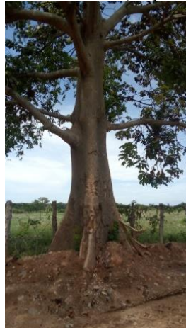
Arbol No. 11