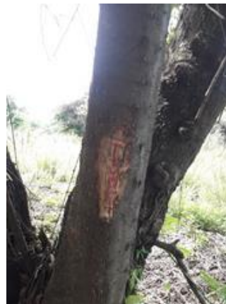
Arboles No. 4 y 5