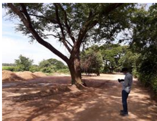
Arboles No. 2 y 3