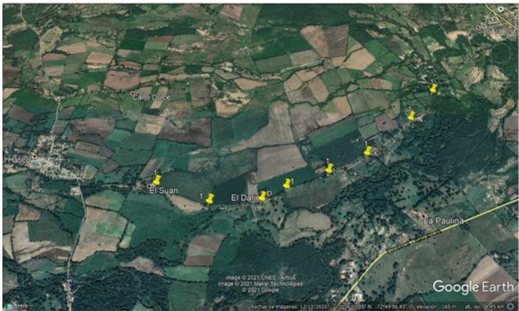
Imagen.2. Ubicación satelital zona de interés.