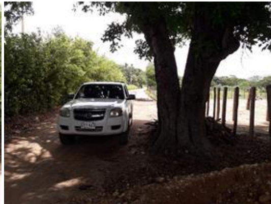
Arbol No. 1