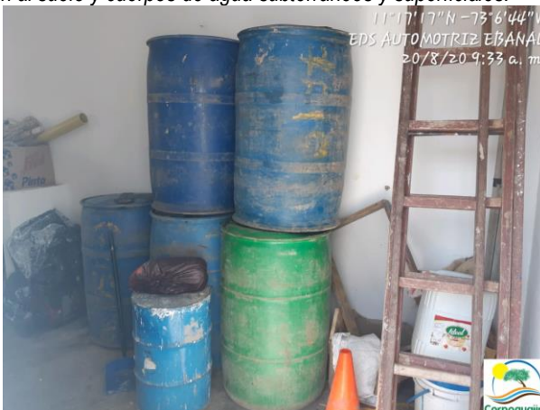
Fotografía No. 7-8: Almacenamiento inadecuado de combustibles. EDS AUTOMOTRIZ EBANAL. 20 de agosto de 2020.

Es de aclarar que, la responsabilidad del generador subsiste, hasta que el residuo peligroso sea aprovechado como insumo o dispuesto finalmente en depósitos o sistemas técnicamente diseñados y no represente riesgo para la salud humana y el ambiente, tal como lo establece, el Decreto 1076 del 2015, en su Art. 2.2.6.1.3.3, por lo cual el establecimiento, debe gestionar estos residuos con organismos o entidades que cuenten con las licencias, permisos, autorizaciones o demás instrumentos de manejo y control ambiental a que haya lugar.