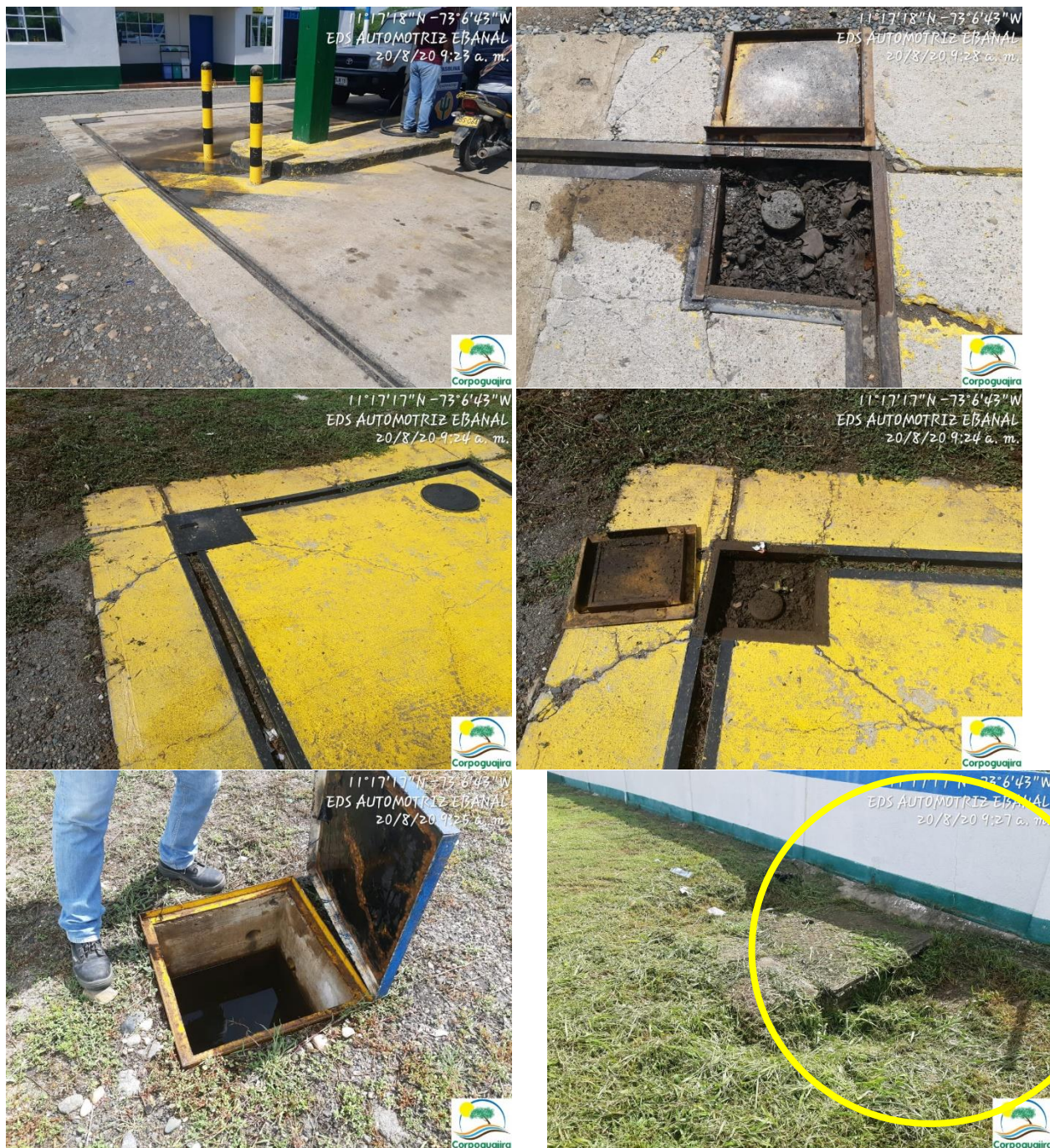
Fotografías No.9-14: Canal perimetral, cajillas recolectoras, trampa de grasa y poza séptica. EDS AUTOMOTRIZ EBANAL. 20 de agosto de 2020.

3.2.5 CONTROL DE RUIDO: De acuerdo a lo observado en la visita, es posible se genere ruido intermitente derivado del funcionamiento o puesta en marcha de la planta eléctrica que posee el establecimiento. En el seguimiento no se logró percibir la intensidad de ruido que emite dicha planta cuando se encuentra encendida, de tal manera que se tenga percepción de posible afectación al ambiente y personal flotante.