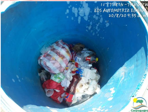
Fotografía No. 3-6: contenedores para el almacenamiento temporal de residuos sólidos. EDS AUTOMOTRIZ EBANAL. 20 de agosto de 2020.