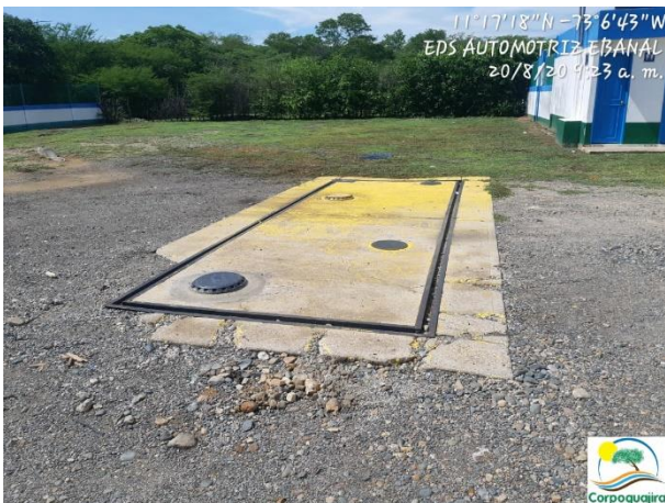
Fotografías No. 1-2: Venta y almacenamiento combustible. EDS AUTOMOTRIZ EBANAL. 20 de agosto de 2020.