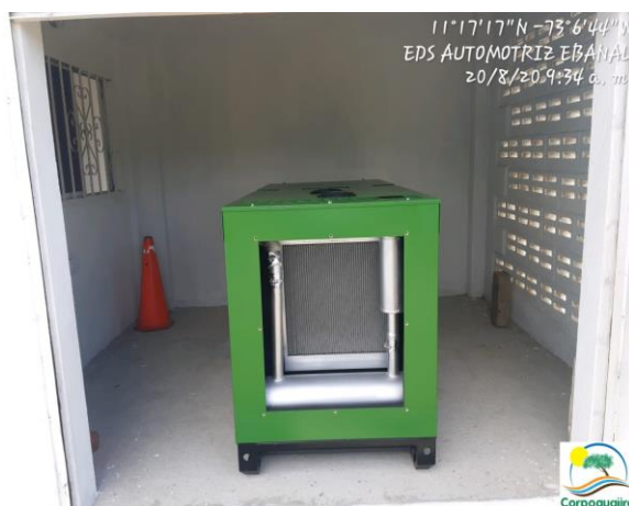
Fotografía No.15: Planta eléctrica. EDS AUTOMOTRIZ EBANAL. 20 de agosto de 2020.