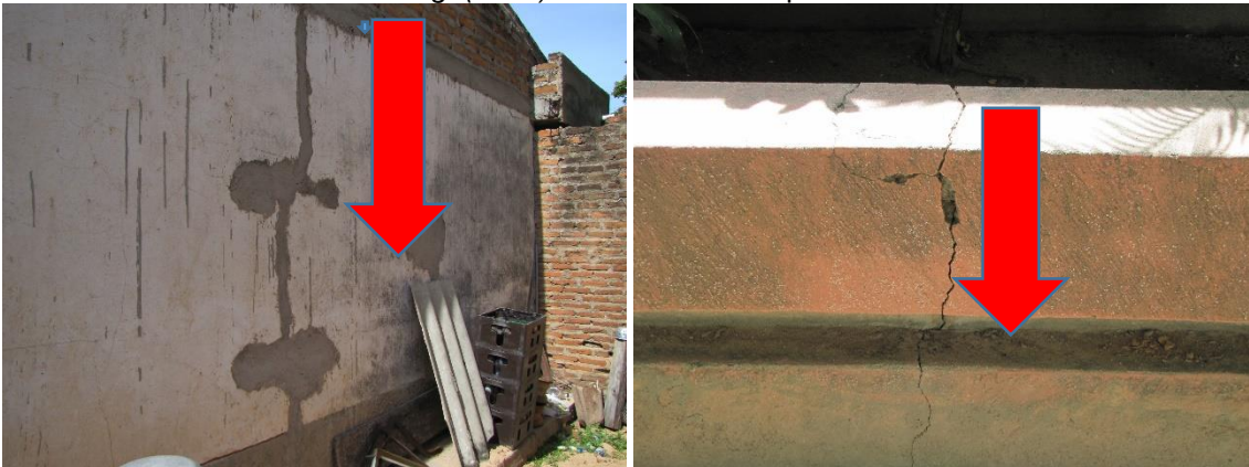
Img. (6 – 7). Fisuras de las paredes por causa del Ficus elástica