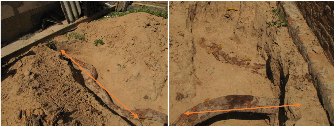
Img. (4 – 5). Raíces del árbol problema