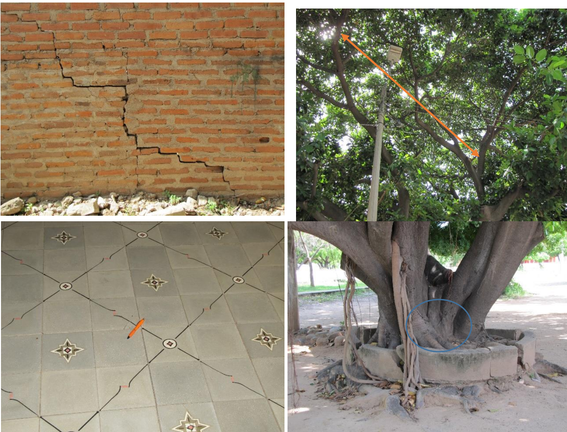
Img (8 – 11). Evidencias de los impactos ocasionados por el Ficus