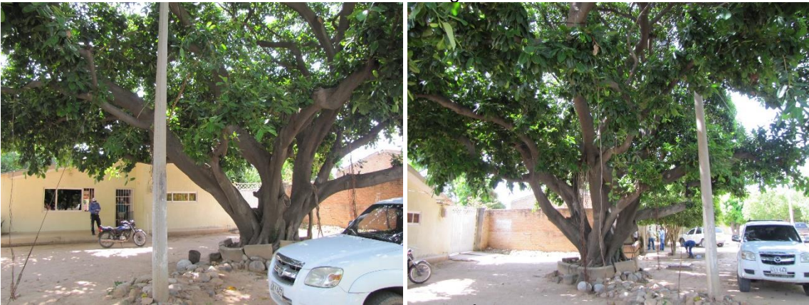
Img.(2 – 3) Ficus elástica , Árbol problema