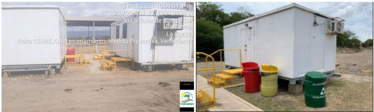
Fotografías 4,5 y 6: Evidencia de la visita ocular en campo, que demuestra que se realizó la recolección de los residuos sólidos, esparcidos por el área del taller. (Fuente: Corpoguajira – marzo 15 – 2021.

El encargado del área manifiesta que debido a todos los inconvenientes para el desarrollo de estas labores que esta medida ha generado, están diseñando unos proyectos pilotos para generar conciencia en sus colaboradores e implementar estrategias que garantice una mejorara significativa y permanente en el manejo de los residuos generados en cada área de la empresa y así evitar el mal almacenamiento de los mismos y estas situaciones presentadas.