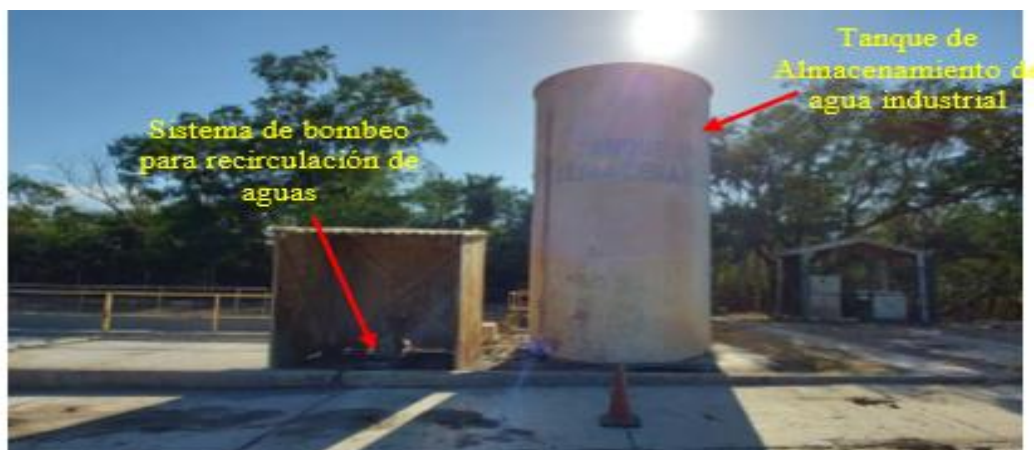
Fotografía 2 Sistema de recirculación del lavadero del sur

Por su parte, en la Figura 1, se presenta la infraestructura asociada a dicho lavadero, donde se detalla los componentes estructurales del sistema de tratamiento que la conforman, con el fin de describir el curso y tratamiento al cual es sometida el agua dentro de esta instalación.