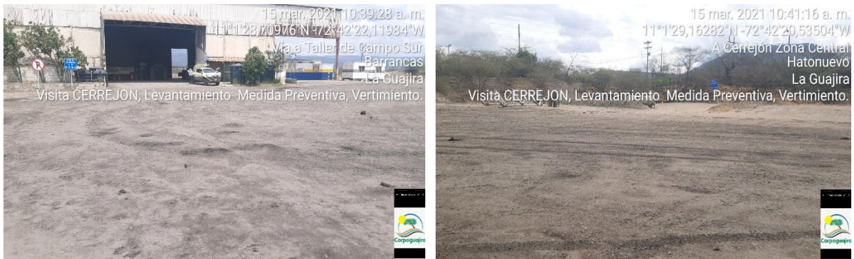
Fotografías 7, 8,9 y 10: Evidencia de la visita ocular en campo, que demuestra que se realizó la recolección de los residuos sólidos, esparcidos por el área del taller y el estado actual del área. (Fuente: Corpoguajira – marzo 15 – 2021