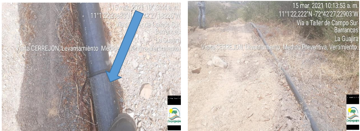
Fotografías 1 y 2: Evidencia de la visita ocular en campo, que demuestra que se corrigió la fuga que causaba el encharcamiento y se subsano el vertimiento al suelo.

De acuerdo a lo evidenciado en campo se manifiesta que la empresa Carbones del Cerrejón Limited, realizo mejoras en el área tendientes al cambio de los tramos de la manguera que estaban deteriorados y que causaban el vertimiento al suelo, además realizo la recolección de los suelos en el punto indicado por la Autoridad Ambiental, cambiando el suelo enlodado, por material seco por lo que no se observa el encharcamiento observado en la visita del 03 de diciembre del 2019 y que genero el hallazgo.