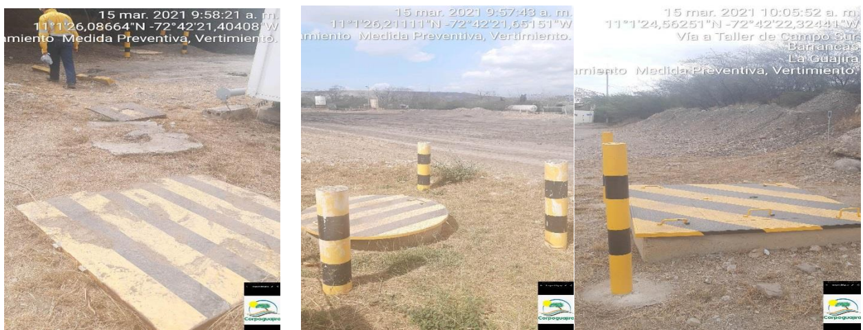
Fotografías 1, 2,3: Evidencia del estado actual de la infraestructura del sistema de pozos sépticos

En el momento de la visita de seguimiento ambiental (03 de diciembre 2019) que origino la suspensión y la medida preventiva, se evidenció que el estado de los tanques y trampas era de abandono, que las infraestructuras requerían limpieza y adecuación del área, por encontrarse muchos residuos y heces fecales en la zona. En el marco de la visita de verificación (marzo 15 del 2021) y el escrito presentado por la empresa donde solicitan la suspensión de la medida, se observó y verifíco que la empresa realizo el mantenimiento de las estructuras que conforman las trampas y tanques de almacenamiento, los cuales en el momento se encuentran en estado óptimo de funcionamiento.