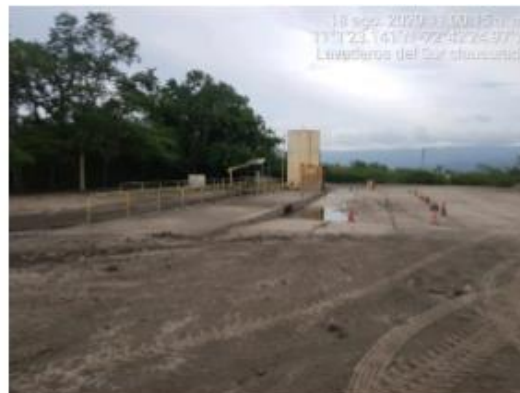
Fotografía 1: Evidencias de la suspensión del lavado de vehículos livianos en la zona de talleres del sur