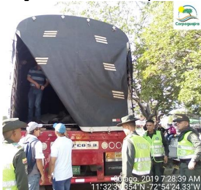
Vehículo con madera sin salvoconducto Distrito de Riohacha, La Guajira, 30 agosto de 2019