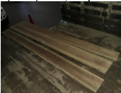
Tablas de Cordia gerascanthus