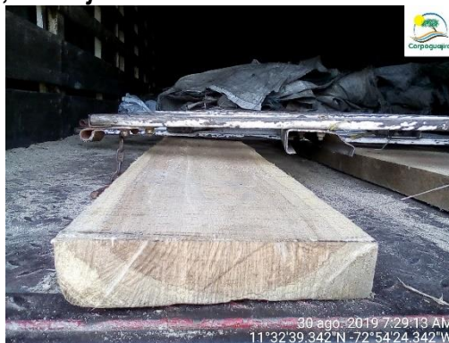
Moncoro o Solera – Cordia gerascanthus

La incautación fue realizada debido a que el presunto infractor movilizaba el producto maderable sin salvoconducto.