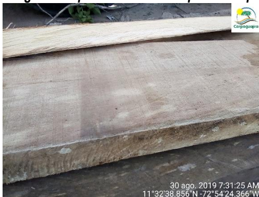
Ceiba bonga – Ceiba pentandra Distrito de Riohacha, La Guajira, 30 agosto de 2019