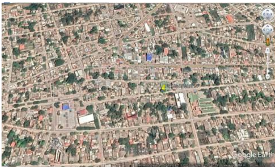
Fig. 2. Ubicación del área a intervenir.