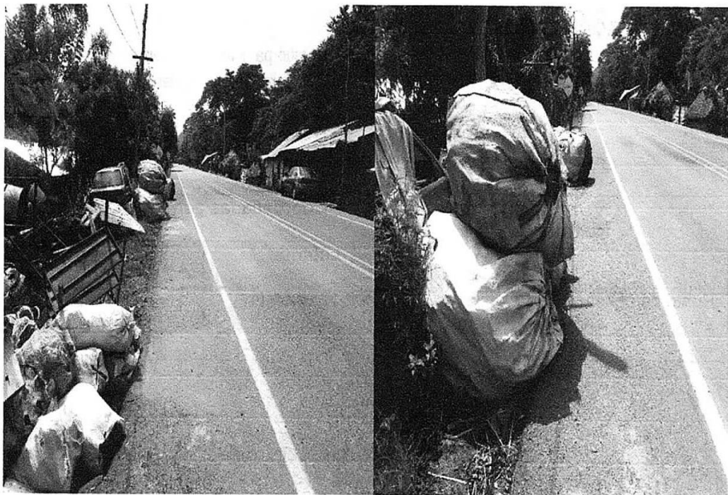
Fotografía 1 Residuos sólidos dispuesto a orillas de la troncal caribe