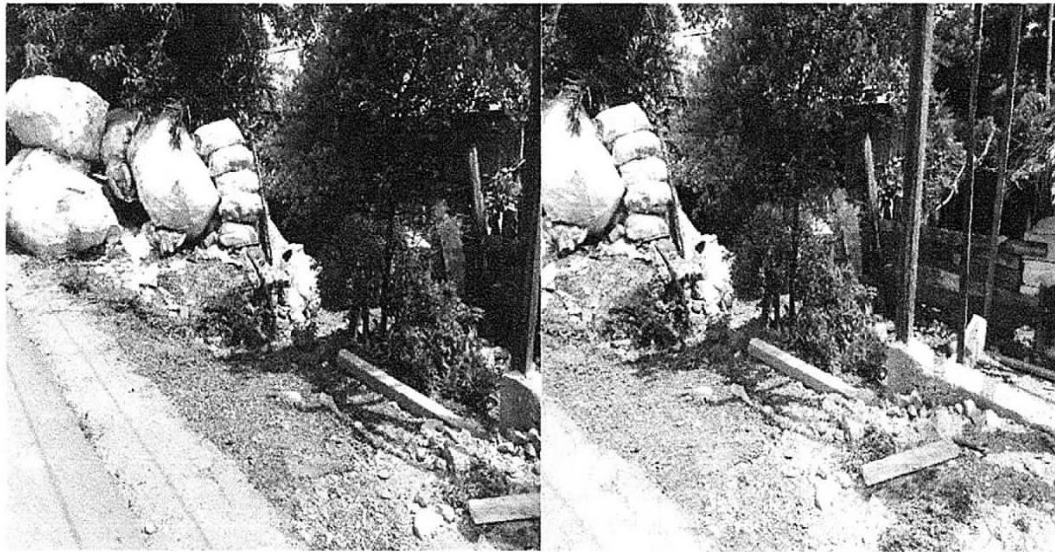
Fotografía 1 Residuos sólidos dispuesto a orillas de la troncal caribe