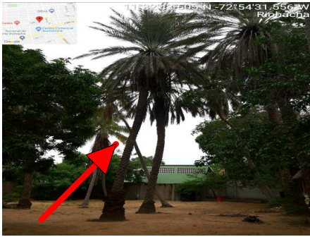
Calle 13 No. 24 – 43. 02/09/2020