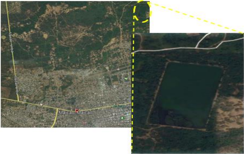
IMAGEN No 1. Ubicación espacial del sistema de tratamiento de aguas residuales del municipio de Maicao.