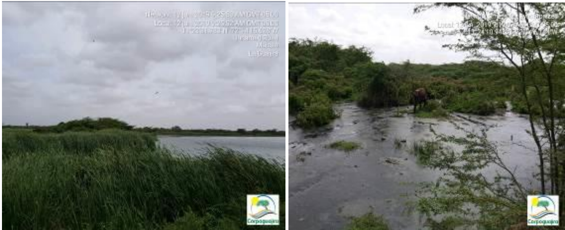
FOTOGRAFÍAS No 1 - 2. Laguna de oxidación limoncito. Sistema de tratamiento de aguas residuales colmatado de lodos y presencia de material vegetal y animales dentro del sistema. Seguimiento realizado en Junio de 2019.

Con base a que no se pudo realizar la inspeccion ocular al sistema de tratamiento de aguas residuales domesticas, como evidencia del estado de dicho sistema se presentan las fotografias de la visita anterior, hace 4 meses.