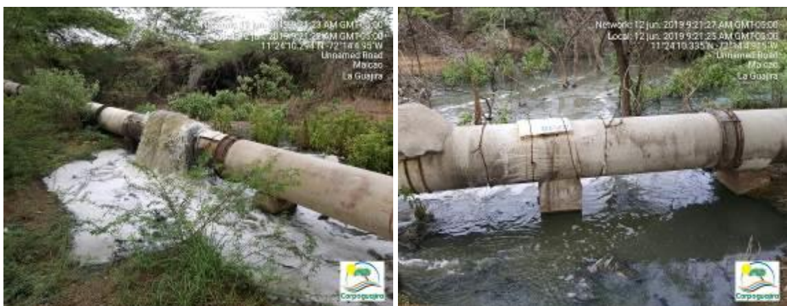
FOTOGRAFÍAS No 3 - 4. Tubería de entrada de agua residual al sistema de tratamiento, rota y vertiendo agua residual por fuera del sistema. Seguimiento realizado en Junio de 2019.