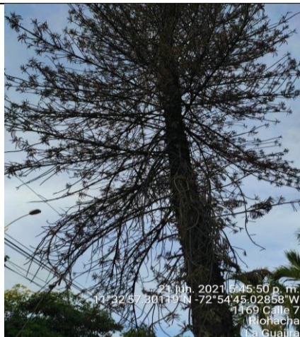
Foto 4. Sección de la parte media y alta del árbol

Se logra observar en las imágenes la inclinación pronunciada y el estado fitosanitario del mismo, en el cual se evidencia el follaje totalmente seco Foto 2, Generando riesgo de caerse.