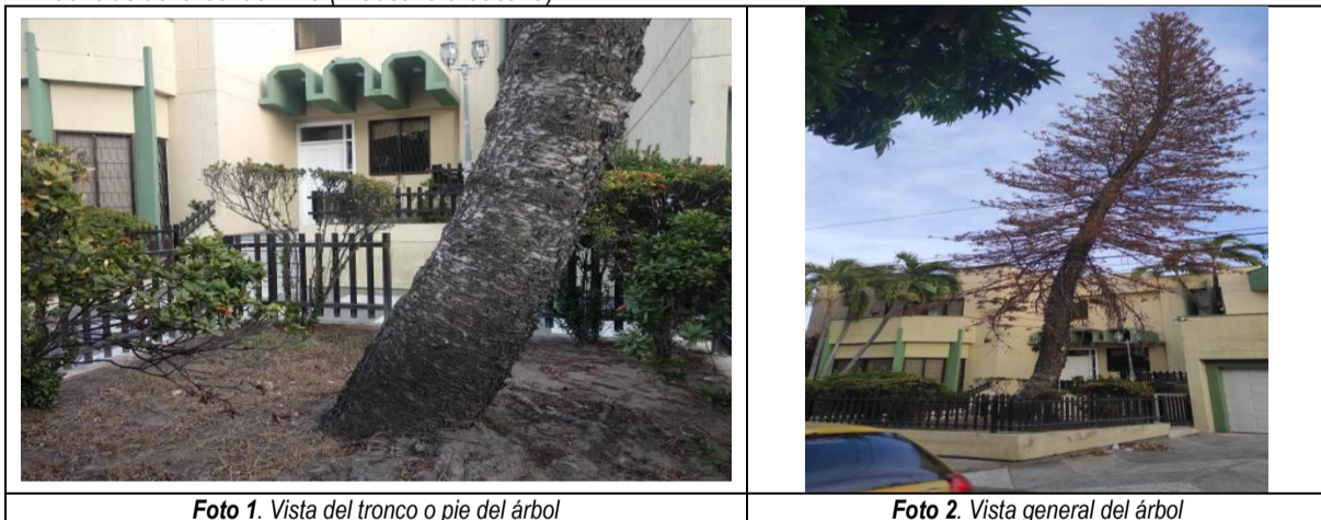
Foto 1. Vista del tronco o pie del árbol