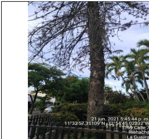
Foto 3. Sección de la parte baja y alta del árbol