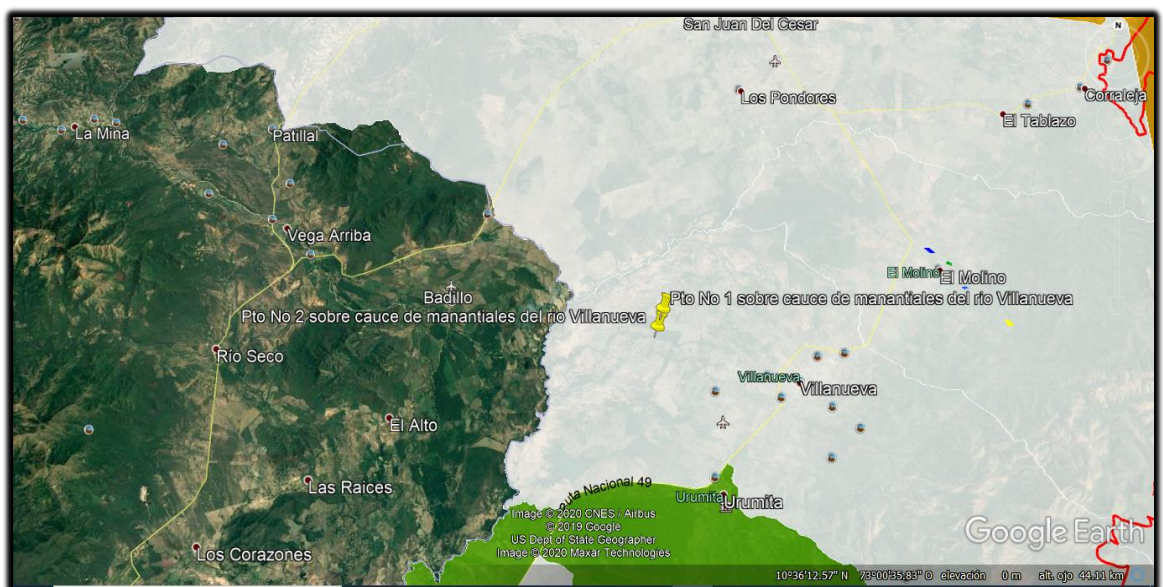
Imagen 1: Ubicación sitios de interés