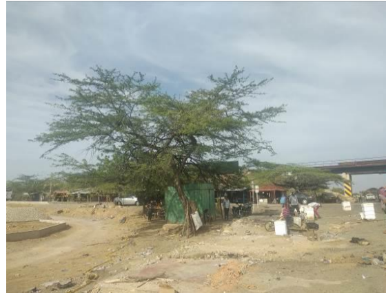
Foto 2. Árbol de Trupillo ( Prosopis juliflora ) visto en sentido vía Troncal del Caribe