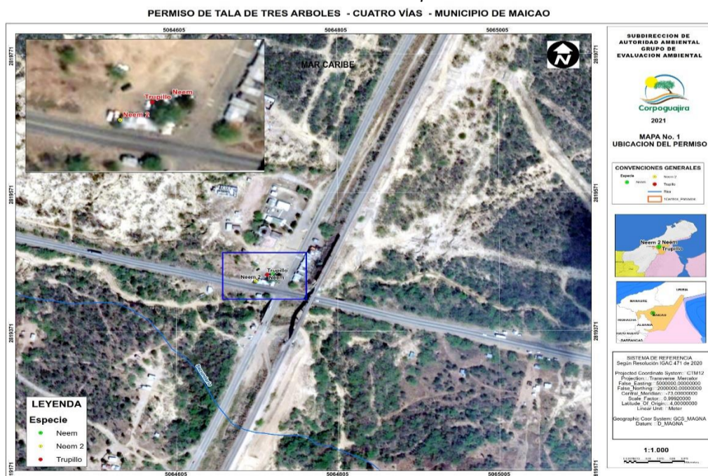
Gráfico 1. Ubicación del permiso