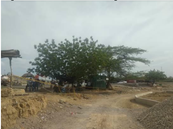
Foto 1. Árbol de Trupillo ( Prosopis juliflora ) junto con el árbol de Neem ( Azadirachta indica )

Las siguientes son las evidencias fotográficas tomadas en la visita