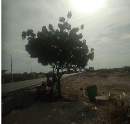
Foto 3. Árbol de Neem ( Azadirachta indica ) ubicado paralelo a la vía Troncal del Caribe