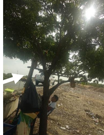
Foto 4. Árbol de Neem ( Azadirachta indica ) ubicado en el derecho de vía Troncal del Caribe

En el sitio se evidencio que algunos kioscos ubicados en la margen izquierda de la vía Troncal del Caribe ya fueron destruidos, así mismo se evidencian los arreglos o modificaciones en el acceso de vía sentido troncal vía Urbía margen izquierda frente al parador turístico, lo que demuestra que requieren modificar el sector para el acceso de los vehículos de gran tamaño y quitar al personal vendedor que se hace paralelo al derecho de vía.