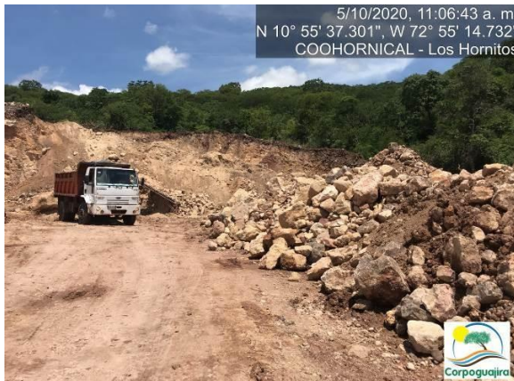
Fotografía No. 19 y 20. Vehículos tipo camión o volteos utilizados para transportar los minerales extraídos. CENTRO MINERO COOHORNICAL.

Por otra parte, se logró evidenciar que en las instalaciones del Centro Minero Coohornical, se realizan las actividades de mantenimiento de maquinaria pesada, ya que en el momento de la visita se constató suelo impregnado de aceite, el cual se filtra en el suelo ocasionando la perdida total de las propiedades físicas y químicas.