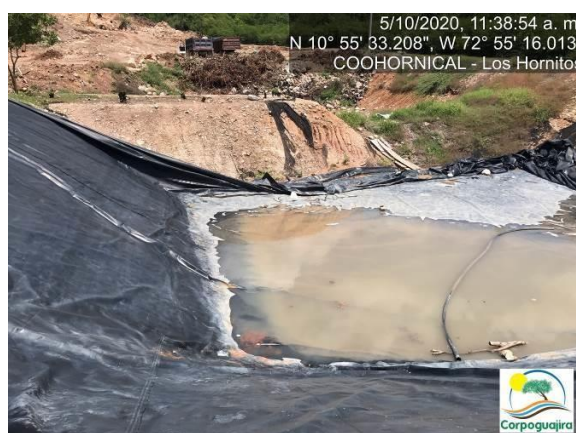
Fotografía No. 25 y 26. Relavera construida para la recolección de las aguas residuales no domesticas provenientes de la empresa Sira Minerales S.A.S. CENTRO MINERO COOHORNICAL..