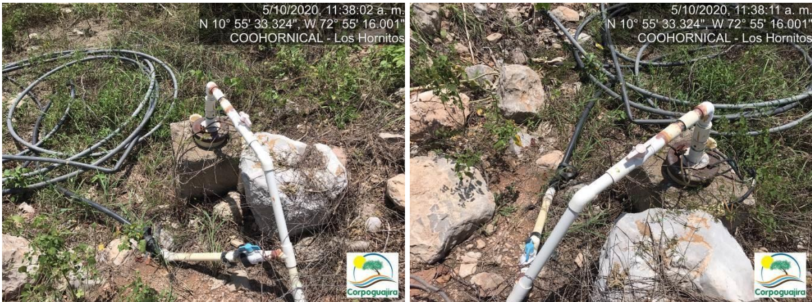
Fotografía No. 07 y 08. Pozo subterráneo construido para el aprovechamiento de aguas. CENTRO MINERO COOHORNICAL.