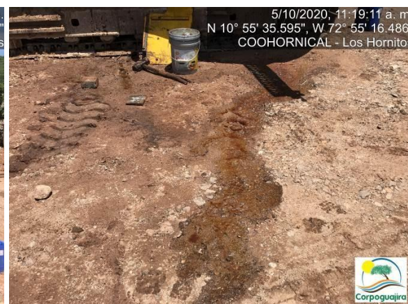
Fotografía No. 21 y 22. Contaminación del suelo por el vertimiento de aceites e hidrocarburos derivados de mantenimiento de maquinaria pesada. CENTRO MINERO COOHORNICAL.