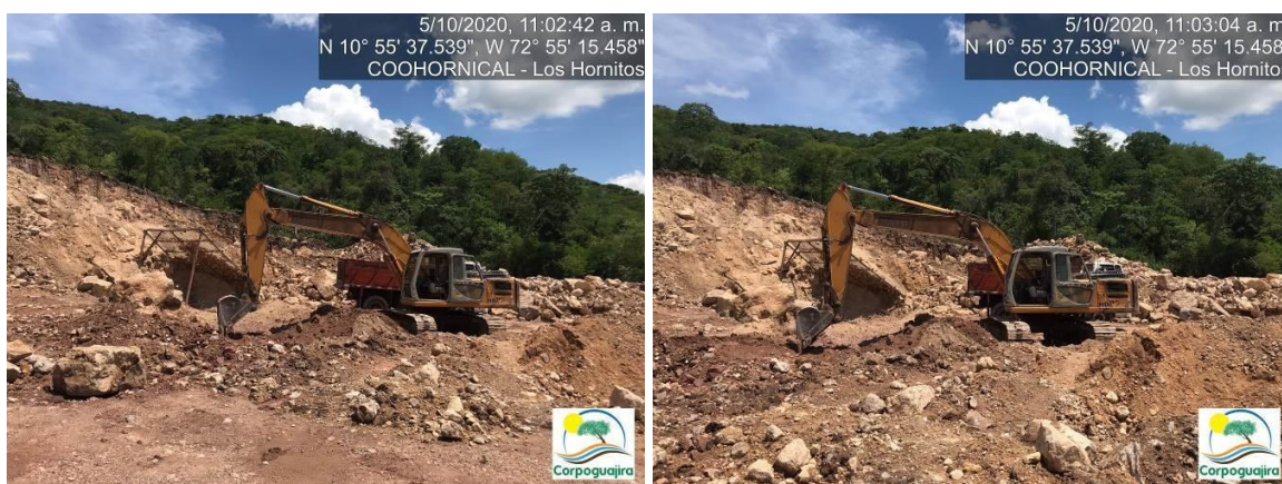
Fotografía No. 17 y 18. Extracción de roca caliza con la utilización de maquinaria pesada. CENTRO MINERO COOHORNICAL. (Fuente: Corpoguajira 2020).

La Agencia Nacional de Minería – ANM mediante Resolución No. 0254 del 17 de octubre de 2017, modificada por la Resolución No. 0153 del 09 de julio de 2019, procede a declarar y delimitar un Área de Reserva Especial Los Hornitos en el Municipio de Distracción, Departamento de La Guajira. Este Acto Administrativo faculta a los mineros tradicionales para la explotación de roca caliza, con el objeto de adelantar estudios geológicos – mineros y desarrollar proyectos estratégicos para el país de conformidad con lo dispuesto en los artículos 31 y 248 de la Ley 685 de 2001 (Compilada en el Decreto Único Reglamentario del Sector Administrativo de Minas y Energía 1073 de 2015).