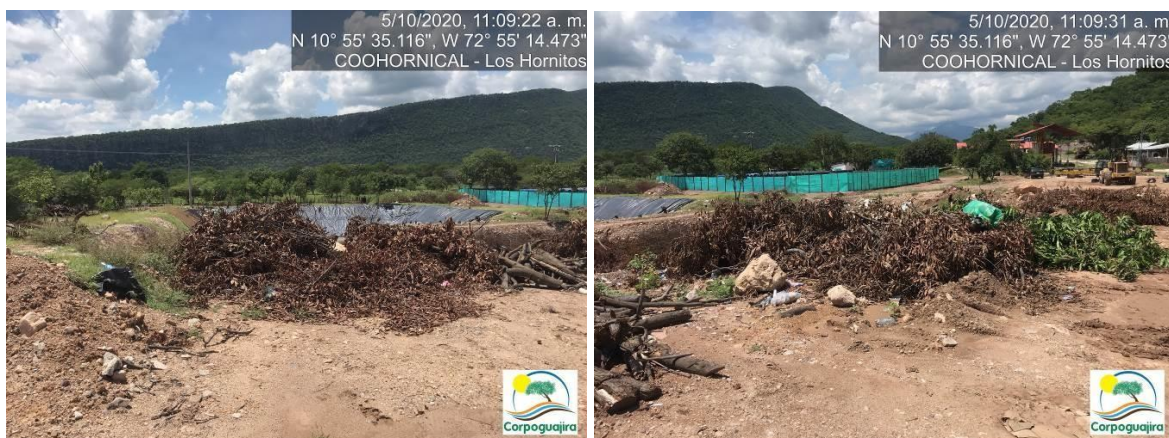
Fotografía No. 29 y 30. Material vegetal aprovechado y depositado en un costado de la Relavera construida para la recolección de las aguas residuales no domésticas. CENTRO MINERO COOHORNICAL. (Fuente: Corpoguajira 2020).

En las siguientes fotografías, se evidencia que el material vegetal aprovechado sin el respectivo permiso de la zona de explotación es depositado a un costado de la Relavera construida para el manejo de las aguas residuales no domésticas, presentándose gran acumulación de residuos en esta zona.