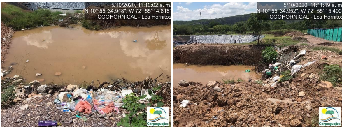
Fotografía No. 33 y 34. Residuos sólidos ordinarios depositados en un costado de la Relavera construida para la recolección de las aguas residuales no domésticas. CENTRO MINERO COOHORNICAL.