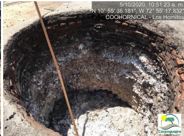
Fotografía No. 11 y 12. Hornos incineradores construidos en las instalaciones del centro minero. CENTRO MINERO COOHORNICAL.

Cabe destacar que la Resolución No. 0386 del 18 de febrero de 2016, solo amparaba las emisiones realizadas por la Planta de Trituración de Materiales Pétreos, por lo que se puede determinar que los hornos incineradores, nunca han estado amparados por un Permiso de Emisiones Atmosféricas, que garantice el cumplimiento de los niveles máximos permisibles a emitir al ambiente.