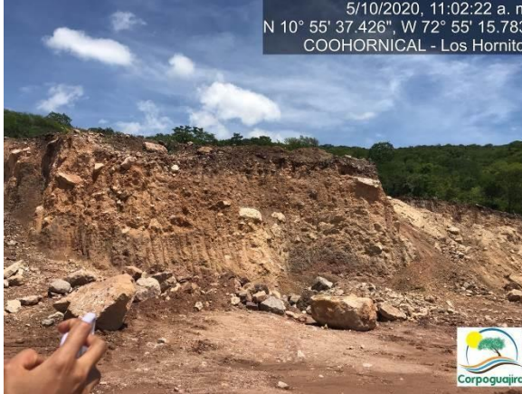
Fotografía No. 05 y 06. Área deforestada para realizar actividades de extracción de minerales. CENTRO MINERO COOHORNICAL.