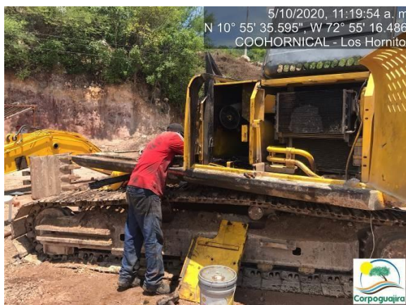
Fotografía No. 23 y 24. Contaminación del suelo por el vertimiento de aceites e hidrocarburos derivados de mantenimiento de maquinaria pesada. CENTRO MINERO COOHORNICAL.

Por otro lado, durante la visita de seguimiento ambiental, se evidenció que dentro de las instalaciones se realizó la remoción de suelo para la construcción de una Relavera con unas dimensiones de 35 metros de largo x 25 metros de ancho y 7 metros de profundidad, el cual fue cubierto con una geomembrana de alta dureza, con la finalidad de recoger las aguas residuales no domesticas - ARnD resultantes de las actividades realizadas por la empresa SIRA MINERALES S.A.S en los procesos beneficio de Mineral Cobre. El funcionamiento de esta Relavera quedo avalada en la Resolución No. 0385 del 18 de febrero de 2016, la cual otorga un Permiso de Vertimiento a la empresa SIRA MINERALES S.A.S.