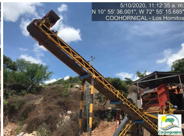
Fotografía No. 13 y 14. Planta de Trituración Materiales Pétreos. CENTRO MINERO COOHORNICAL. (Fuente: Corpoguajira 2020).