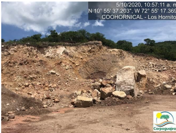
Fotografía No. 03 y 04. Área deforestada para realizar actividades de extracción de minerales. CENTRO MINERO COOHORNICAL.