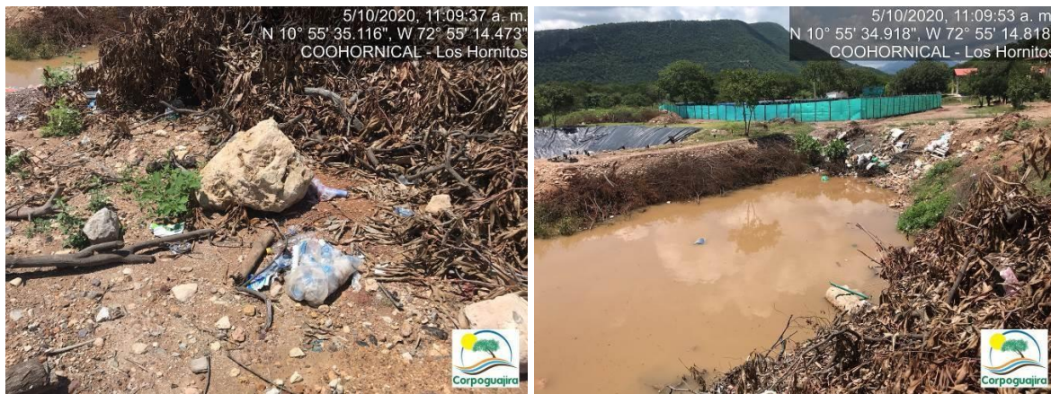
Fotografía No. 31 y 32. Material vegetal aprovechado y depositado en un costado de la Relavera construida para la recolección de las aguas residuales no domésticas. CENTRO MINERO COOHORNICAL. (Fuente: Corpoguajira 2020).

Se evidenció también que los residuos sólidos ordinarios como (bolsas, papel, cartón, plástico) no son recolectados, clasificados y marcados como lo determina el Decreto Único Reglamentario del Sector Ambiente y Desarrollo Sostenible 1076 de 2015, ya que estos son dispuestos de la misma manera que los vegetales, donde por la cantidad de residuos depositados da origen a un botadero satélite; que además estos quedan sumidos dentro de la laguna que se ha formado por la excavación y la acumulación de aguas lluvias.