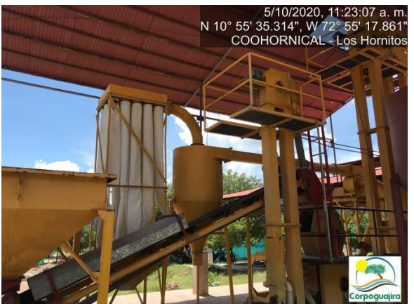
Fotografía No. 15 y 16. Pulverizador y humectador de minerales instalado en el centro minero. CENTRO MINERO COOHORNICAL. (Fuente: Corpoguajira 2020).