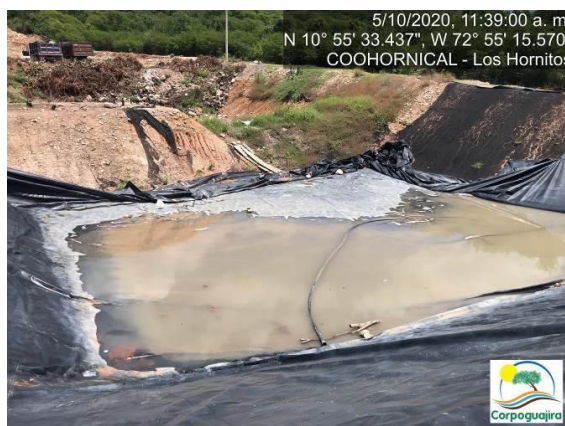
Fotografía No. 27 y 28. Relavera construida para la recolección de las aguas residuales no domesticas provenientes de la empresa Sira Minerales S.A.S. CENTRO MINERO COOHORNICAL.