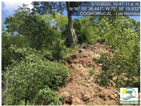
Fotografía No. 01 y 02. Árboles con raíces descubiertas por la actividad de extracción de materiales. CENTRO MINERO COOHORNICAL.