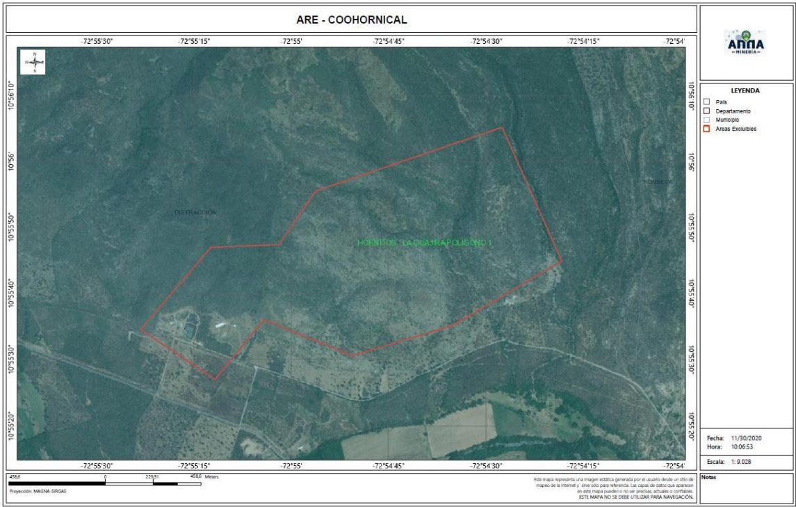
Imagen 1. Ubicación geográfica de las instalaciones del Centro Minero Coohornical.

Las actividades de la empresa Coohornical se ubican en inmediaciones de San Luis II del Corregimiento de Los Hornitos, jurisdicción del Municipio de Distracción, con una extensión de 6 hectáreas, exactamente en el Kilómetro 6 de la vía que comunica a Distracción con el Corregimiento de Chorreras, en las Coordenadas Geográficas N 10°55'36.2" y W 72°55'15.7".