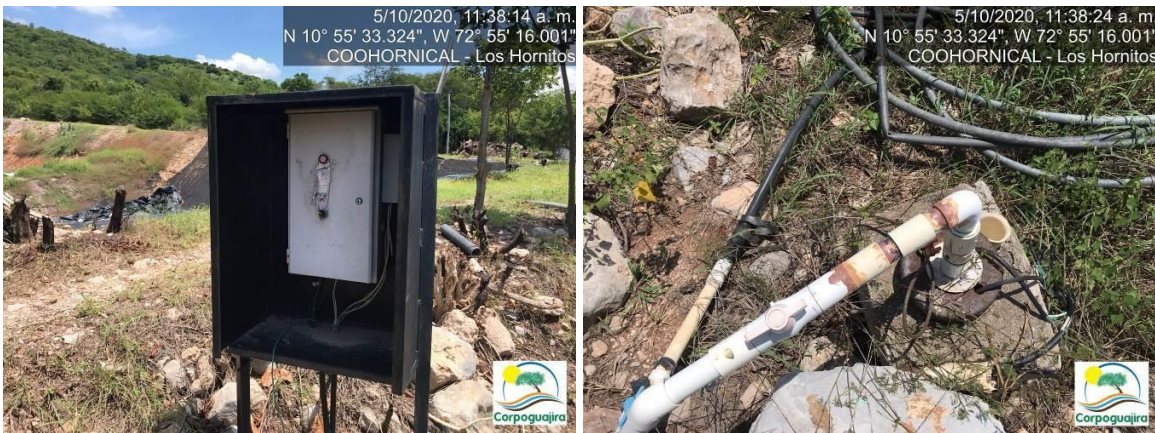
Fotografía No. 09 y 10. Pozo subterráneo construido para el aprovechamiento de aguas. CENTRO MINERO COOHORNICAL..