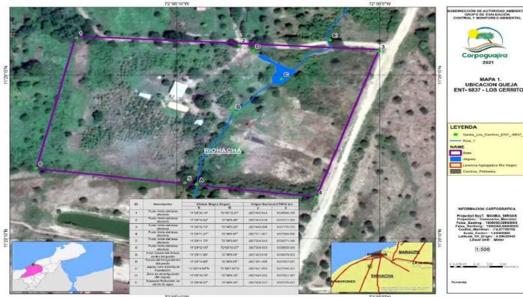
Fuente: Corpoguajira, 2021.