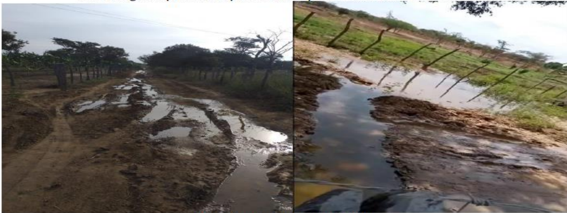
Foto 5. Agua represada supuestamente proveniente del molino de viento.