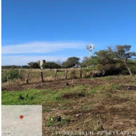
Foto 4. Molino causante de problemática según querellante