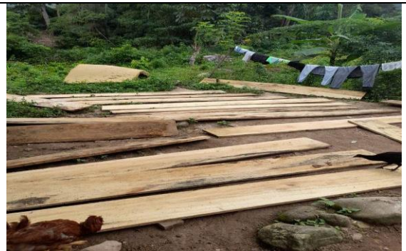
Foto 9 . Tablas extraídas del árbol de higuierón caído y en regular estado