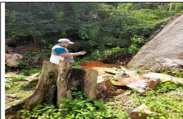
Foto 3. Resto de árbol seco atrofiado por quema