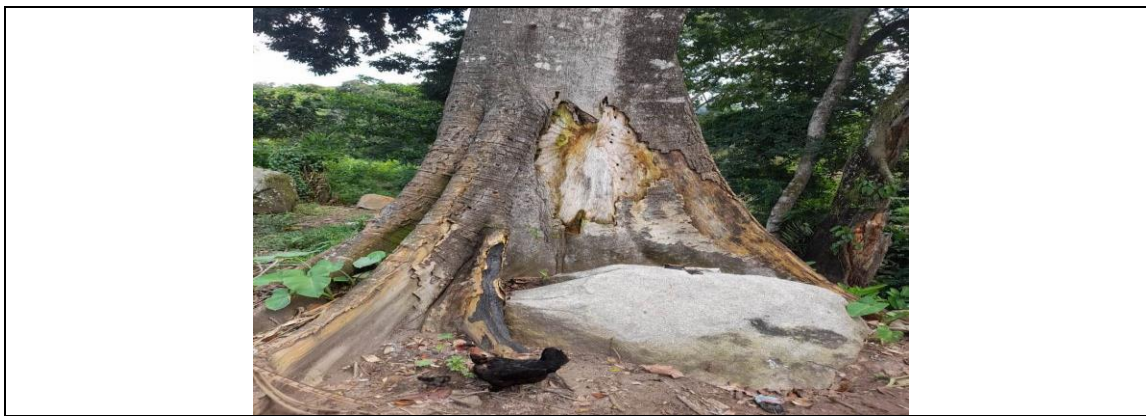
Foto 7 , árbol de higuierón ( Ficus glabrata ) afectado en la base del pie