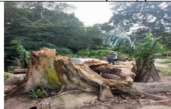
Foto 8 . Árbol de higuierón seco caído, se observa el estado seco del espécimen