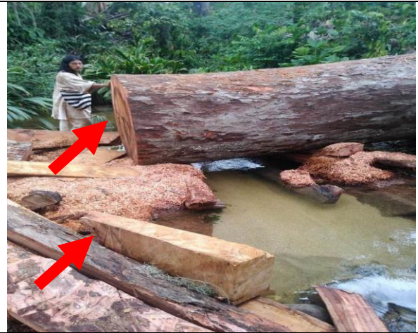
Foto 13. En la imagen resiente al corte del árbol, se logra evidenciar en donde está la mano del indígena Kogui que el árbol presenta problemas fitosanitario de igual manera en el bloque extraído ubicado dentro del cauce