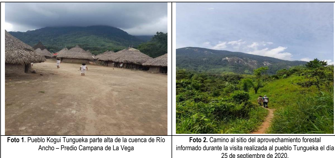
Foto 1. Pueblo Kogui Tungueka parte alta de la cuenca de Río Ancho – Predio Campana de La Vega