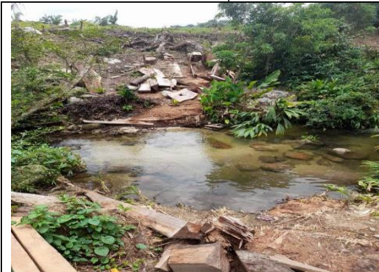
Foto 14. Sitio donde el árbol de caracolí cayó sobre el arroyo campana de la vega, se observa que el flujo del agua circula libremente pero existe material vegetal (desperdicio) producto de la extracción de la madera utilizable dispersas en ambas márgenes y en área de influencia de altas crecidas