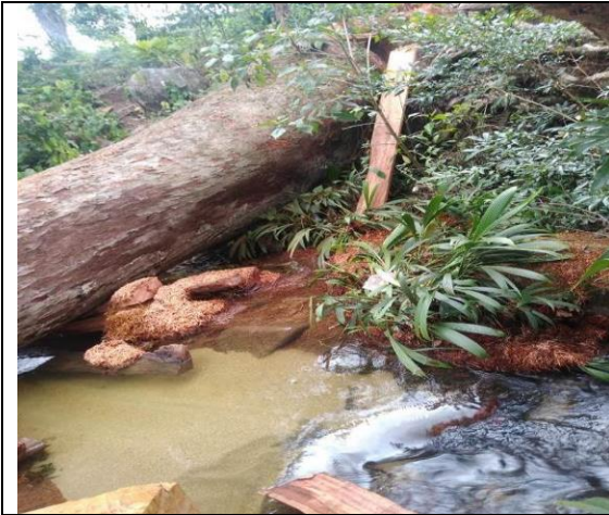
Foto 12. Árbol de caracolí sobre el arroyo campana de la vega, unos metros abajo del pueblo Tungueka