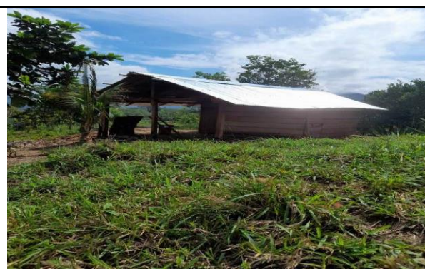
Foto 6. Casa construida con la madera obtenida en la parcela del señor JORGE TARRA RAD CC. 84085312,