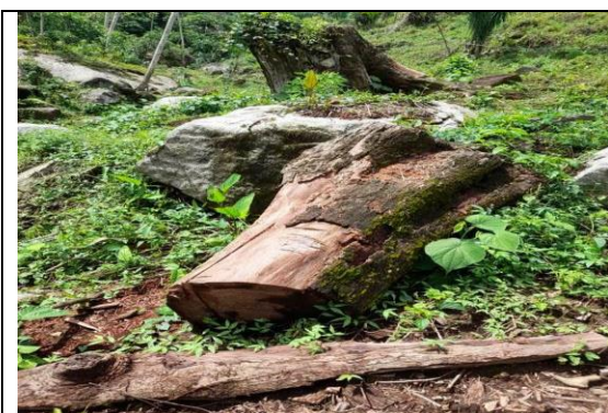
Foto 5. Resto de árbol aprovechado en área de zocola