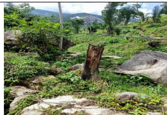
Foto 4. Zocola, quema y área convertida en potrero