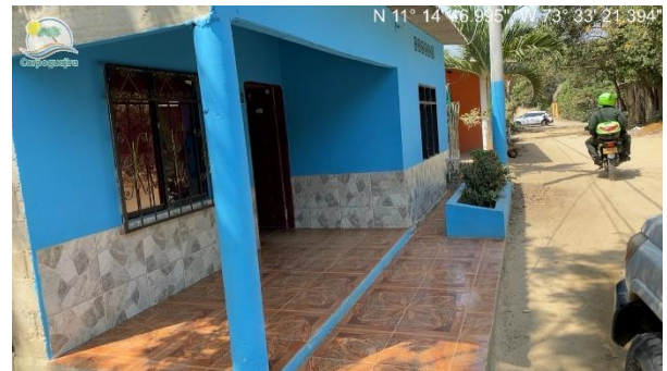
Foto 2. Evidencia de verificación en el Punto 2.