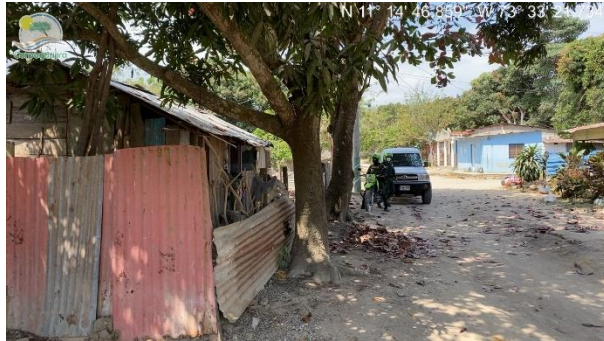
Foto 1. Evidencia de verificación en el Punto 1.