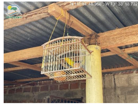
Foto 4. Evidencia de ave en cautiverio ( Sicalis flaveola ) en el Punto 3.