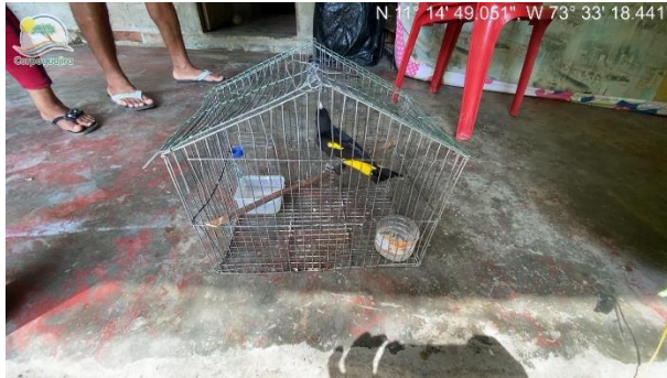
Foto 3. Evidencia de ave en cautiverio ( Cacicus cela ) en el Punto 3.