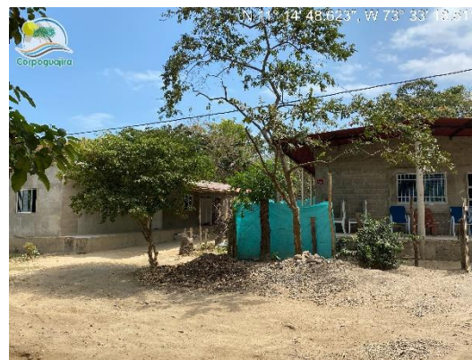
Foto 5. Evidencia de verificación en el Punto 4.

Imagen 1. Ubicación del sitio de la queja (creada utilizando Google Earth – para ilustrar el sitio visitado en el corregimiento de Palomino, Dibulla)