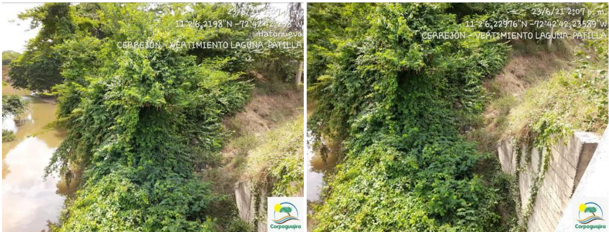
Fotografías No. 7 y 8. Punto de vertimiento de aguas Laguna Patilla. CARBONES DEL CERREJON LIMITED – CERREJON. COMPLEJO MINA. 23 de junio del 2021..