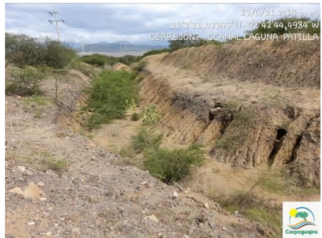
Fotografías No. 3 - 6. Canal de vertimiento de aguas Laguna Patilla. CARBONES DEL CERREJON LIMITED – CERREJON. COMPLEJO MINA. 23 de junio del 2021.