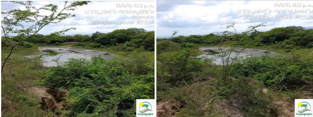
Fotografías No. 1 y 2. Estado de la Laguna Patilla. CARBONES DEL CERREJON LIMITED – CERREJON. COMPLEJO MINA. 23 de junio del 2021. (Fuente: Corpoguajira).

Se puede apreciar una laguna sedimentada en la que CERREJÓN no ha iniciado las labores de adecuación de dicha laguna, la capacidad que manifiesta el permiso de vertimiento, no corresponde la capacidad actual de la laguna, y de acuerdo con las condiciones para las cuales se otorgó dicho permiso, también carece de las condiciones adecuadas y planteadas en el precitado permiso. Se observa vegetación aledaña, producto de regeneración natural por dispersión de las áreas que están cerca, correspondientes a cobertura natural, lo cual le permite dispersar especies hacía áreas despejadas. Las especies arbóreas que rodean la laguna permite la llegada de la avifauna ofreciendo sitios de hábitat y refugio sobre los rapaces que también llegan atraídos por reptiles, lagartos y aves acuáticas o mamíferos pequeños que lleguen a pastar como liebres. Hasta el momento no se observa especies invasoras.