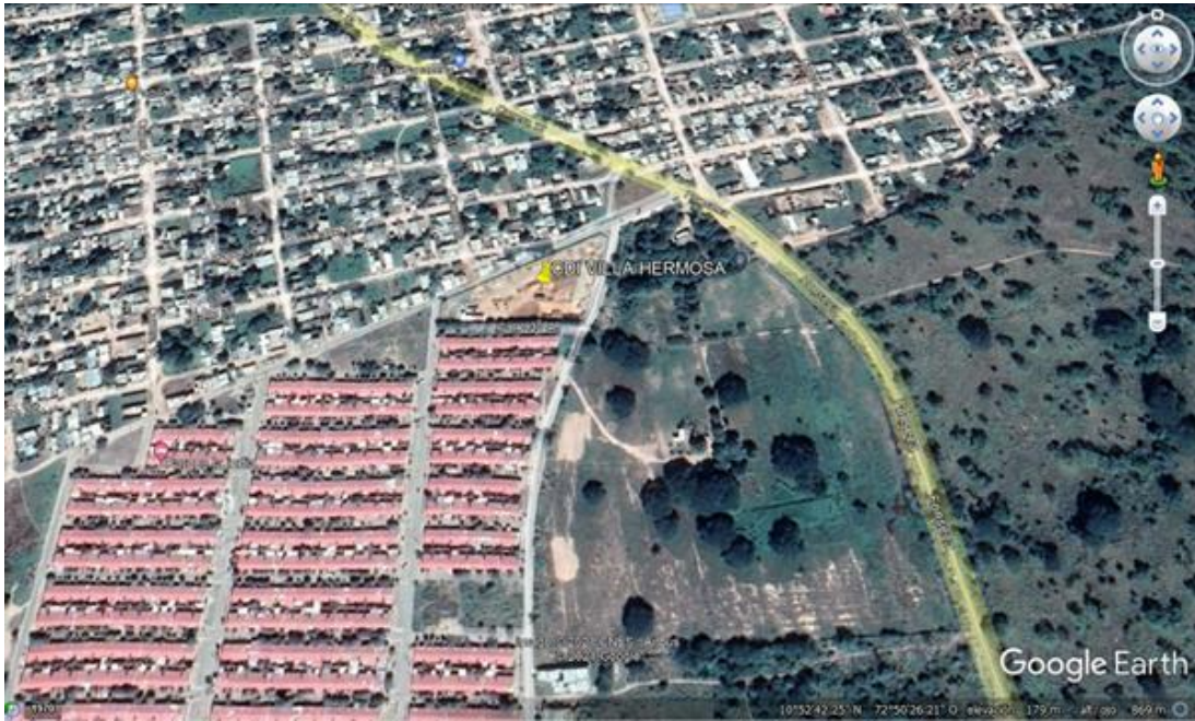
Imagen.2. Ubicación satelital zona de interés.