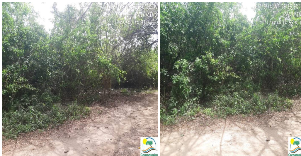
Fotografías No 1 – 2. Sitio destinado para la construcción del STAR del corregimiento de Palomino . 11 de febrero de 2020