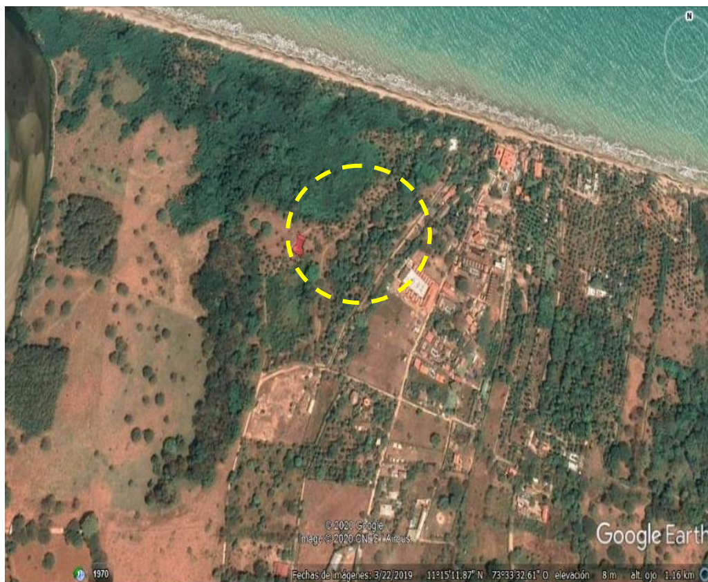
Imagen satelital No. 1. Ubicación geográfica del Sitio destinado para la construcción del STAR del corregimiento de Palomino.