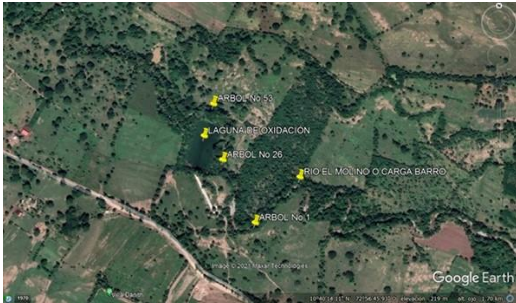
Fig.2. Ubicación satelital zona de interés.