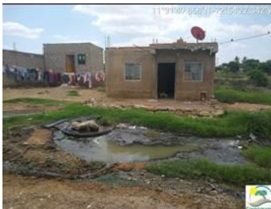
Foto 7 y 8: Manjoles # 4 y 5 respectivamente, vertimiento al suelo los cuales tienen como destino final el humedal Boca Grande – Distrito de Riohacha