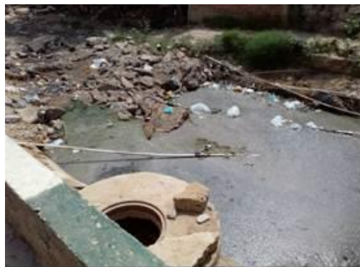
Fotos 1 y 2: Manjol # 1 vertimiento al suelo el cual tiene como destino final el humedal Boca Grande – Distrito de Riohacha