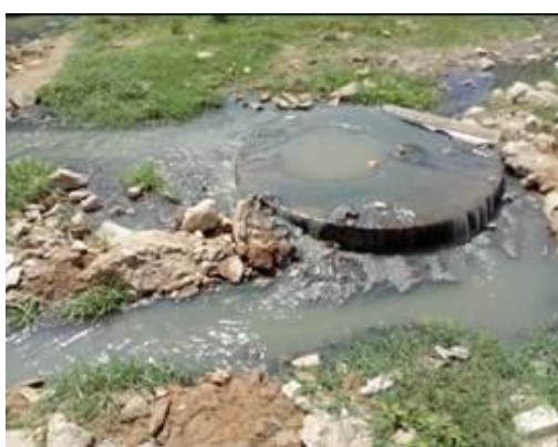
Fotos 3 y 4: Manjol # 2 vertimiento al suelo el cual tiene como destino final el humedal Boca Grande – Distrito de Riohacha