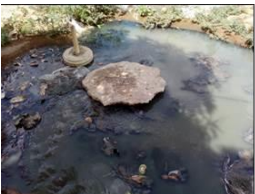
Fotos 5 y 6: Manjol # 3 vertimiento al suelo el cual tiene como destino final el humedal Boca Grande – Distrito de Riohacha