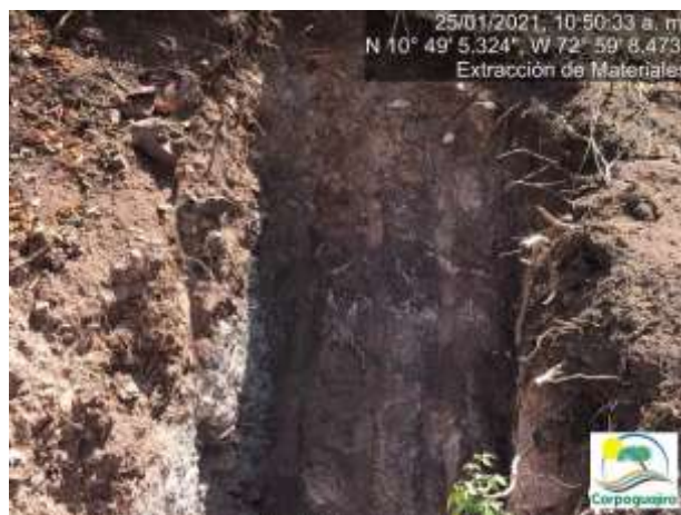
Fotografías No. 19 y 20. Apiques realizados con maquinaria para conocer los materiales a extraer. 25 de enero de 2021.

En las (Fotografías N° 19 y 20) se observa la realización de apiques o calicatas en el área de extracción, esto con la finalidad de conocer detalladamente el subsuelo a remover y el tipo de mineral a extraer, como también se puede evidenciar la existencia de árboles y/o vegetación de gran tamaño o edad, debido a que se presentan en el borde el apique o calicata, las raíces de los árboles que fueron removidos.