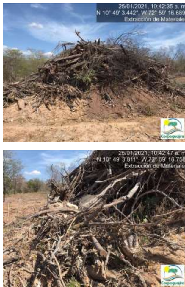
Fotografías No. 13 y 14. Remoción de cobertura vegetal para adecuación de área de almacenamiento de materiales. 25 de enero de 2021.

En el recorrido realizado se tomaron las siguientes evidencias: