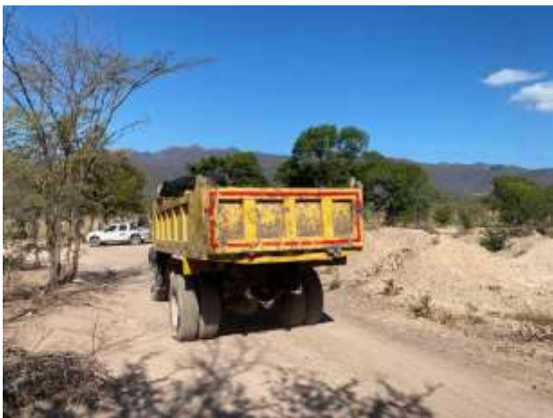
Fotografías No. 11 y 12. Volquetas utilizadas para realizar el transporte de materiales. 20 de enero de 2021.