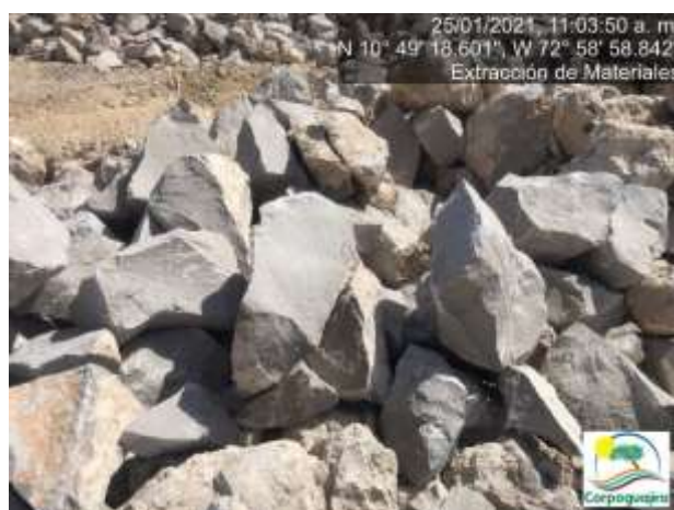
Fotografías No. 33 y 34. Frente o banco de explotación de minerales. 25 de enero de 2021.

Las fotografías N° 31, 32, 33 y 34 nos ilustra el frente o banco de explotación de minerales activo, el cual se encuentra ubicado en la parte alta de la montaña y en el que actualmente se explota el mineral roca caliza, donde por su aspecto y el tamaño de las mismas se muestra una dureza alta, lo que conlleva a que para su fracturamiento se utilice explosivos o un martillo mecánico.