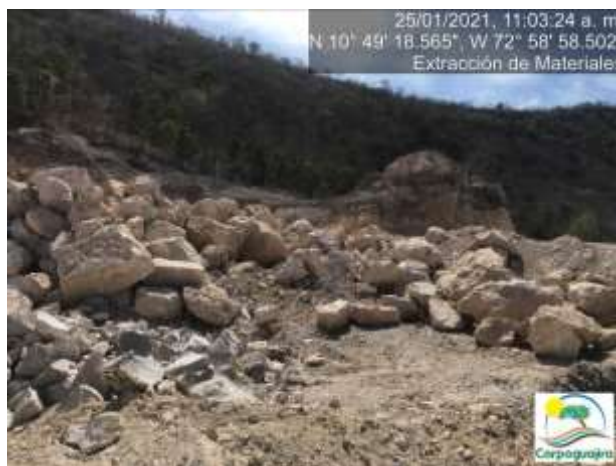
Fotografías No. 31 y 32. Frente o banco de explotación de minerales. 25 de enero de 2021.