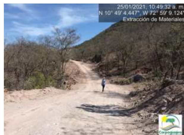
Fotografías No. 17 y 18. Remoción de cobertura vegetal para adecuación de vías internas. 25 de enero de 2021.