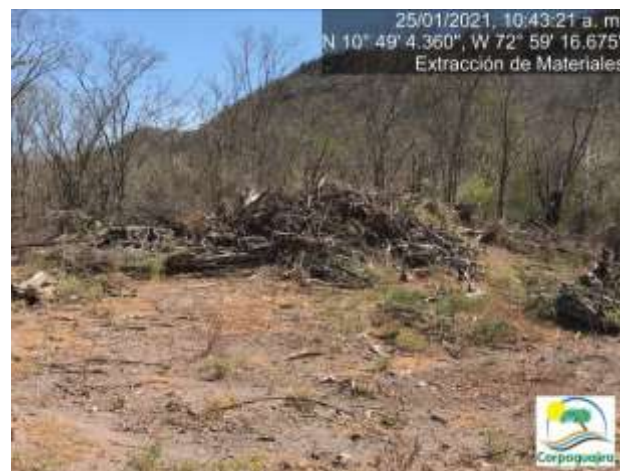
Fotografías No. 15 y 16. Remoción de cobertura vegetal para adecuación de área de almacenamiento de materiales. 25 de enero de 2021. (Fuente: CORPOGUAJIRA 2021).