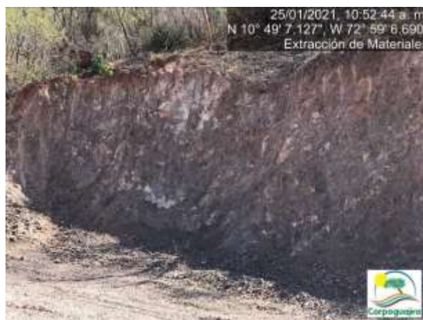
Fotografías No. 23 y 24. Frente o banco de explotación de minerales. 25 de enero de 2021. (Fuente: CORPOGUAJIRA 2021).

De acuerdo a las fotografías No. 21, 22, 23 y 24 se encontró la creación de un frente o banco de explotación, en el que se puede apreciar un conglomerado de minerales, el cual por el estado se puede manifestar que se encuentra en inactividad, debido a que, para el momento de la visita unos metros más arriba se encontraba el frente de explotación activo.