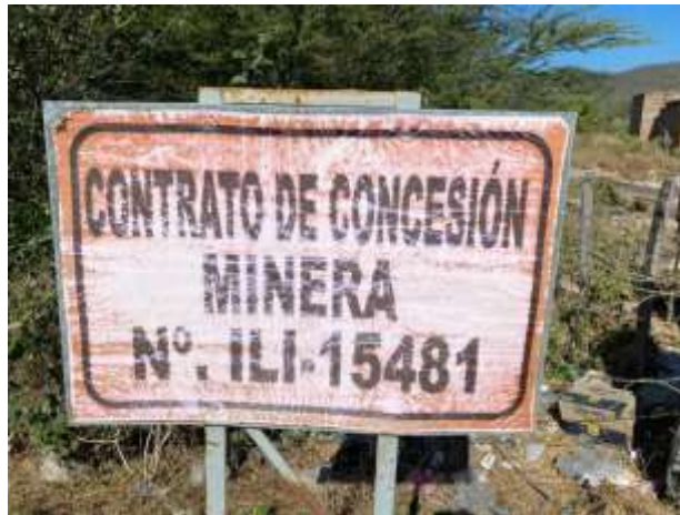
Fotografías No. 1 y 2. Ubicación e información de la Cantera. 20 de enero de 2021.