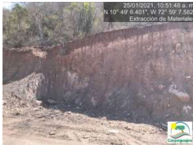
Fotografías No. 21 y 22. Frente o banco de explotación de minerales. 25 de enero de 2021.