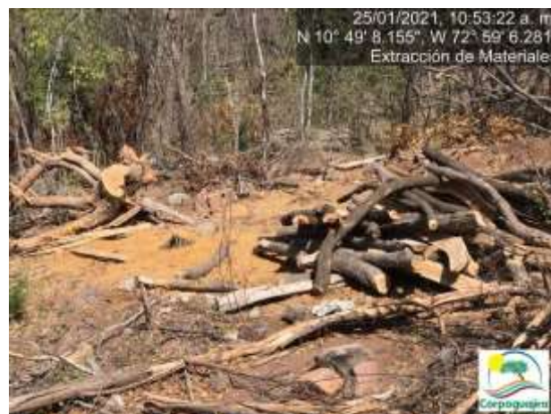
Fotografías No. 27 y 28. Aprovechamiento Forestal de especies nativa dentro de la explotación de minerales. 25 de enero de 2021. (Fuente: CORPOGUAJIRA 2021).