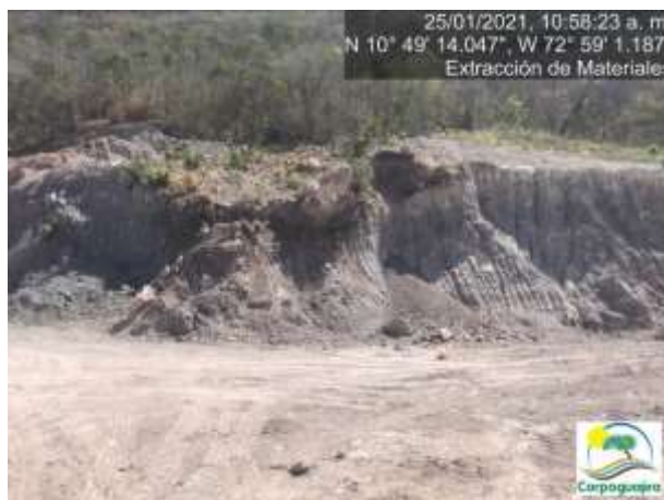
Fotografías No. 29 y 30. Frente o banco de explotación de minerales. 25 de enero de 2021.

En las fotografías N° 29 y 30 se aprecia la creación de otro frente o banco de explotación de minerales, donde resalta la presencia de rocas caliza de gran tamaño.