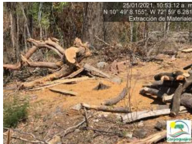
Fotografías No. 25 y 26. Aprovechamiento Forestal de especies nativa dentro de la explotación de minerales. 25 de enero de 2021.