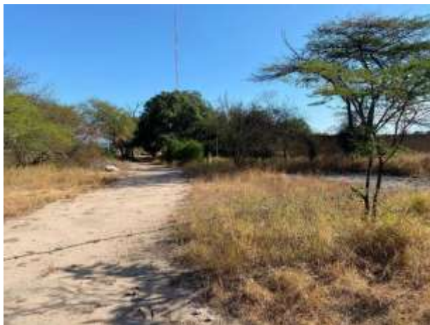
Fotografías No. 3 y 4. Entrada principal a la Cantera y Parte Trasera del Motel Los Deseos. 20 de enero de 2021.