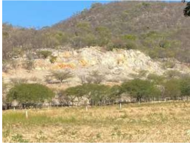
Fotografías No. 5 y 6. Área intervenida sobre la ladera de la montaña. 20 de enero de 2021.