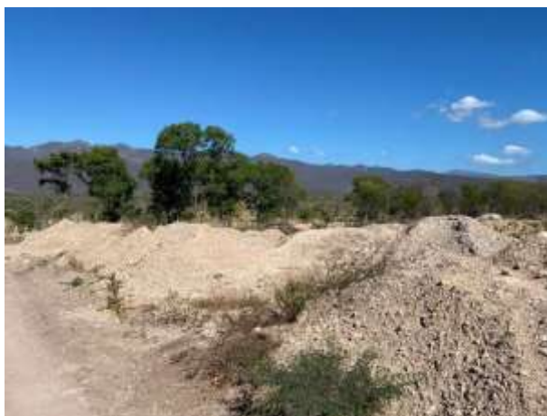
Fotografías No. 7 y 8. Área acopio y almacenamiento de materiales. 20 de enero de 2021. (Fuente: CORPOGUAJIRA 2021).