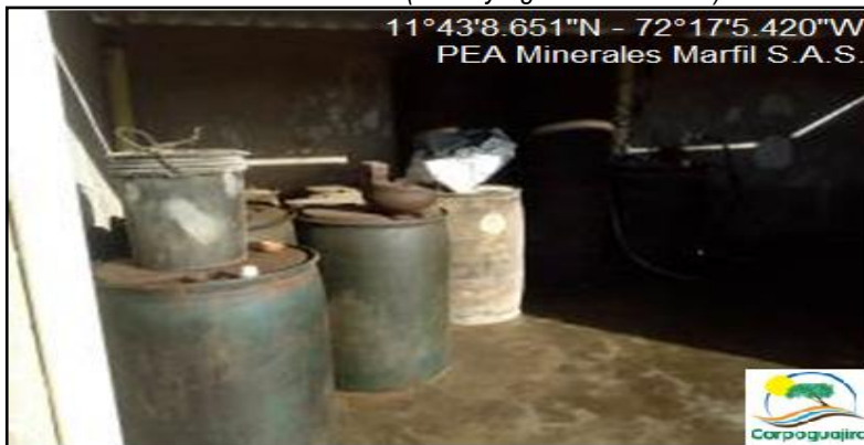
Figura 7. Área de almacenamiento de ACPM.

Por último, en la visita técnica se observó que la empresa posee un área para el almacenamiento del aceite combustible para motores (ACPM) utilizado para la operación de la planta de secado en donde pueden generarse emisiones de compuestos orgánicos volátiles. Si bien el sitio está construido en material resistente (paredes y piso de concreto y techo de Eternit) y posee un sistema drenaje compuesto por un canal para recoger el ACPM derramado en caso de algún accidente; el recipiente de recolección ubicado al final del canal es un cuñete con capacidad de cinco (5) galones, el cual no es del tamaño suficiente para evitar que un derrame mayor no haga contacto con los recursos naturales (suelo y agua subterránea).