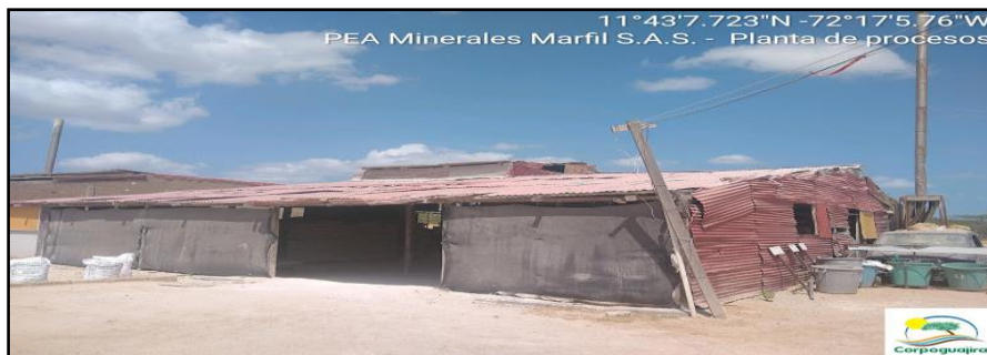
Figura 3. Planta de procesos de la empresa Minerales Marfil S.A.S.