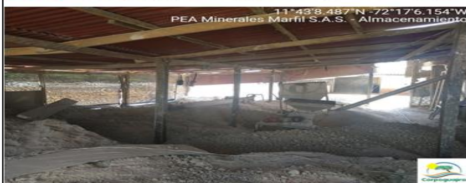
Figura 4. Estado de la estructura física de la empresa Minerales Marfil S.A.S.

La empresa posee un punto de descarga de contaminantes atmosféricos (chimenea) para las emisiones generadas en el calcinador de yeso, desde donde el material particulado es succionado por una turbina que lo hace pasar por un ciclón y unos filtros de mangas para finalmente ser descargados en el punto ubicado en las coordenadas 11°43'8.32" N y 72°17'5.73" W (datum MAGNA-SIRGAS).