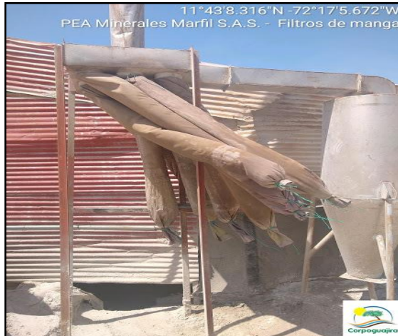
Figura 6. Acción del viento sobre los filtros de manga.

chimenea se encuentran expuestos al ambiente y, debido a las altas velocidades del viento que se generan en la zona, chocan con la estructura metálica de la empresa generando emisiones fugitivas de material particulado tal como se observa en la Figura 6.