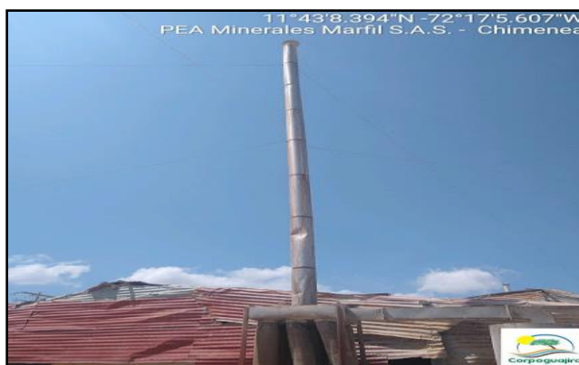
Figura 5. Punto de descarga de contaminantes atmosféricos.

La empresa posee un punto de descarga de contaminantes atmosféricos (chimenea) para las emisiones generadas en el calcinador de yeso, desde donde el material particulado es succionado por una turbina que lo hace pasar por un ciclón y unos filtros de mangas para finalmente ser descargados en el punto ubicado en las coordenadas 11°43'8.32" N y 72°17'5.73" W (datum MAGNA-SIRGAS).