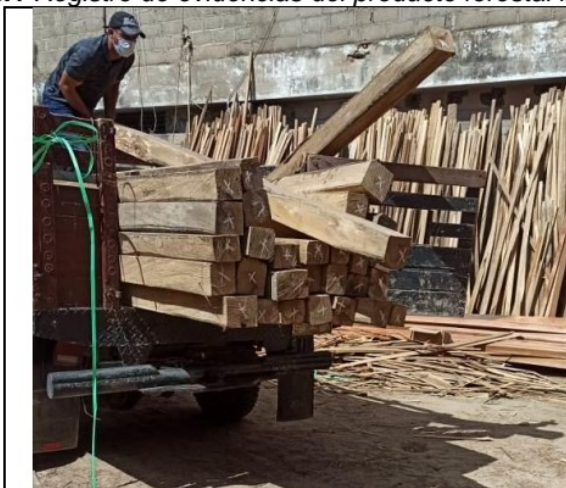
Foto 1. Madera en vehículo al momento de la incautación