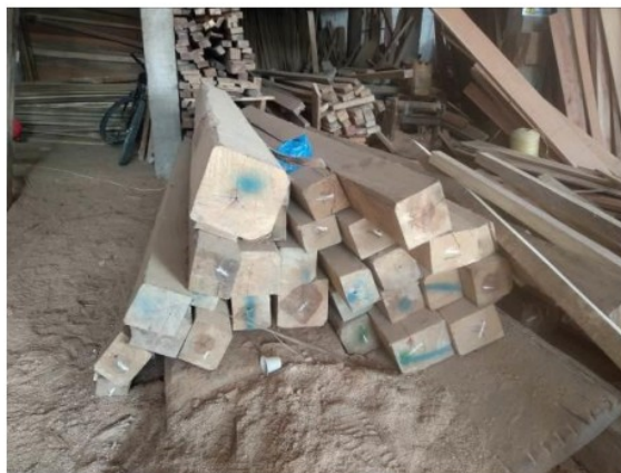
Foto 2. Madera ubicada en el depósito después de la incautación