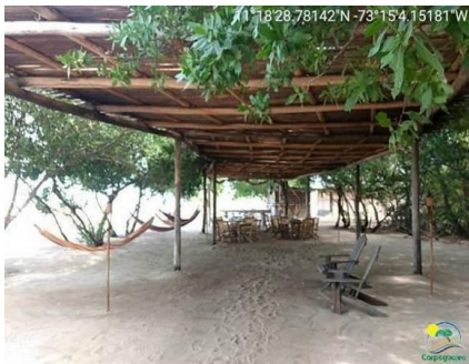
Enramada en medio del manglar, usada como comedor y zona de descanso.