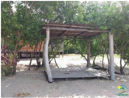
Estructura en madera sobre el área de playa.