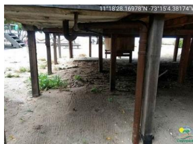
Debajo de la estructura se observa las conexiones hidráulicas para las aguas residuales.