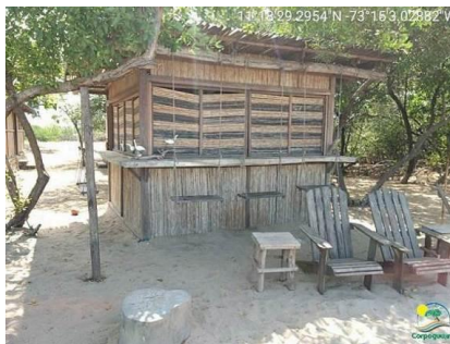
Kiosko sobre el área de playa.