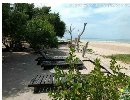
Sillas sobre área de playa.