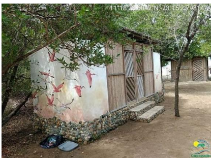
Fachada del baño y residuos sólidos en el sustrato arenoso.