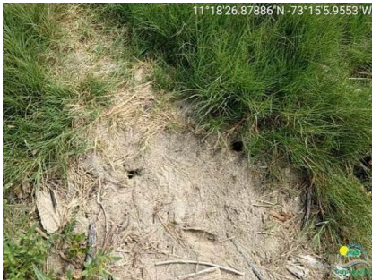
Madrigueras de cangrejo.

Durante el recorrido se observaron madrigueras de cangrejo, especies de mangle como, mangle rojo ( Rhizophora mangle ), mangle zaragoza ( Conocarpus erectus ), mangle salada ( Avicennia germinans ), vegetación de playa como, frijol de playa ( Canavalia rosea ), bejuco de playa ( Ipomoea sp ), verdolaga de playa ( Sesuvium portulacastrum ), y gramíneas.