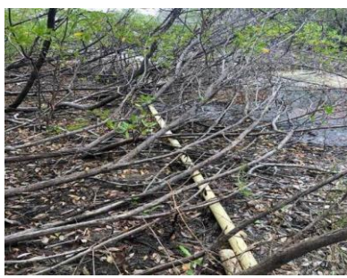
Aguas residuales vertidas directamente en zona del manglar.