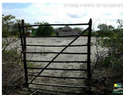
Portón en madera sobre el borde del manglar.