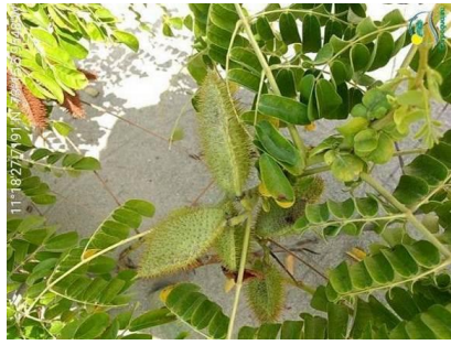
Vegetación de playa.