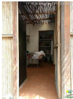
Detalle de la fachada de la cocina y su interior.