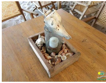
Detalle de los adornos de los comedores.