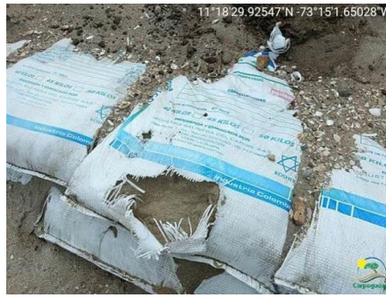
Adecuación artesanal del talud con bultos de arena para contener la erosión costera.