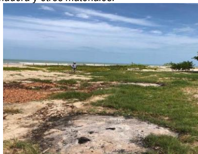
Evidencia de quemas sobre material vegetal