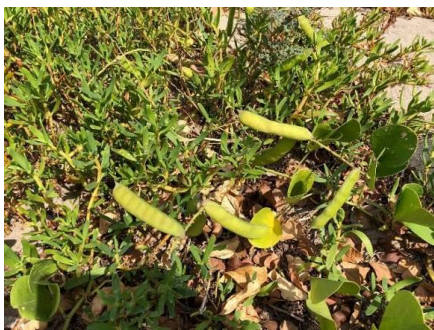
Frijol de playa.