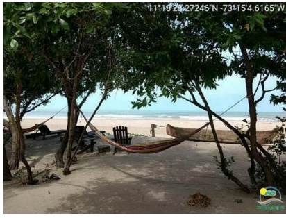
Hamacas amarradas de árboles.