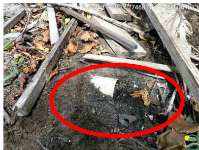
Tubería para la conducción de aguas residuales a una zona del manglar (círculo rojo).