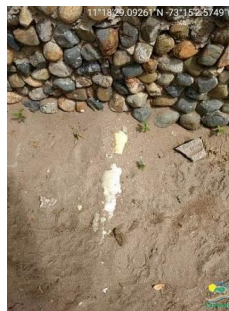
Tubería que sale del baño (en color claro, sobresaliendo parcialmente en la arena).