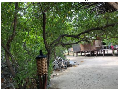
Hojas contaminadas con residuos de hollín.

En varios puntos sobre la zona del manglar (detrás del baño y de las cabañas), se encontraron tuberías que vierten directamente aguas residuales hacia este ecosistema.