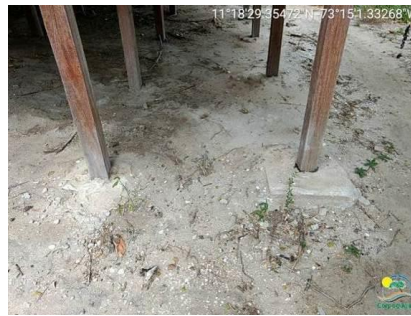
Cabaña principal ubicada sobre la boca de la laguna Mamavita, bases reforzadas en concreto sobre el sustrato arenoso.