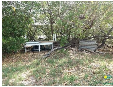
Residuos de madera y otros materiales.