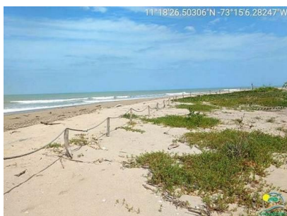
Cerramiento a lo largo de la playa.