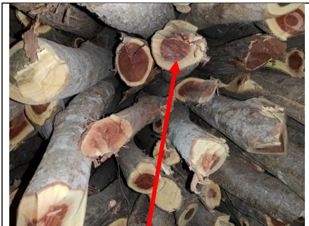
Foto 3 Puntales Espinito colorado