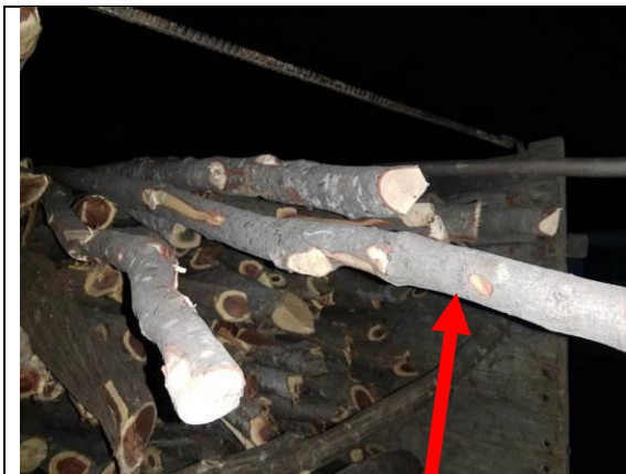
Foto 5. Evidencias de las varas