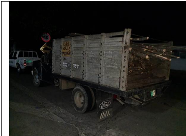
Foto 1. Vehículo con madera

Evidencias del producto forestal maderable incautado y verificado dentro de las instalaciones de la policía de carreteras.