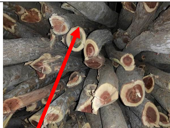
Foto 6. Puntales de Espinito, Trupillo y Guayacan