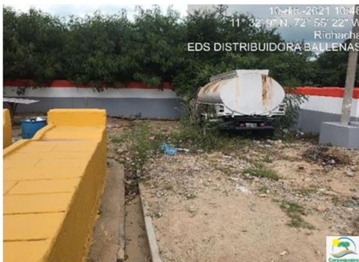
Fotografías No. 4: Lavadero de vehículos. EDS AUTOCENTRO MÓBIL BALLENAS. 10 de diciembre de 2021.