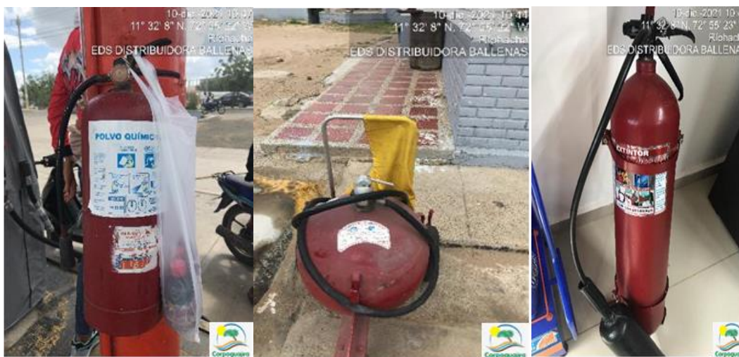
Fotografías No. 17-19: Extintores. EDS AUTOCENTRO MÓBIL BALLENAS. 10 de diciembre de 2021.

3.2.6 SISTEMA DE SEGURIDAD: La EDS AUTOCENTRO MÓBIL BALLENA cuenta con equipo de control de incendios conformados por extintores portátiles ubicados en el área administrativa y la de despacho de combustible, así mismo, mantiene en el área de servicio un extintor rodante tipo satélite. Adicionalmente, cuenta con un kit anti derrame de hidrocarburos; sin embargo, el acompañante de la visita manifiesta no tener un plan de capacitación para manejos de contingencias derivados de accidentes que se puedan presentar.