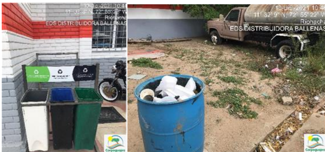
Fotografía No. 5-6: Tanques para el almacenamiento temporal de residuos sólidos. EDS AUTOCENTRO MÓBIL BALLENAS. 10 de diciembre de 2021.

3.2.1 MANEJO DE RESIDUOS SÓLIDOS ORDINARIOS Y APROVECHABLES: En la EDS AUTOCENTRO MOBIL BALLENAS, cuenta con un punto ecológico conformado con tres contenedores tapados y codificados, ubicados en la salida de la oficina, también cuenta con varios contenedores metálicos codificados y tapados donde realizan el almacenamiento temporal de dichos residuos. Los residuos generados son entregados al operador municipal, INTERASEO S.A.E.S.P.