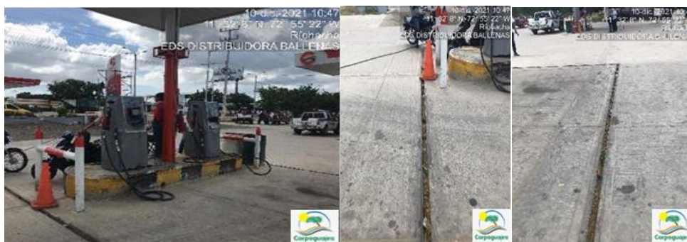
Fotografías No7-9: Canal perimetral. EDS AUTOCENTRO MÓBIL BALLENAS. 10 de diciembre de 2021.

Adicionalmente, la trampa de grasa no se evidencia funcionamiento y se observa que no se le realiza mantenimiento del sistema y el certificado de disposición final de estos residuos, por lo cual, se requiere que el establecimiento presente los planos de dicha trampa de grasa, realice una descripción de su funcionalidad y documente la gestión de los residuos generados en ella.