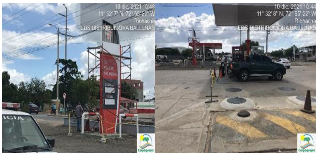
Fotografías No. 1 -2: Venta combustible. EDS AUTOCENTRO MÓBIL BALLENAS. 10 de diciembre de 2021.

3.1.2. CAMBIO DE ACEITES Y LUBRICANTES: La EDS cuenta con un espacio para esta actividad, la cual está conformado por un cárcamo subterráneo de aproximadamente 1.5 m de profundidad. El acompañante de la visita manifiesta que desde hace tres años no se realiza cambio de aceite en este establecimiento