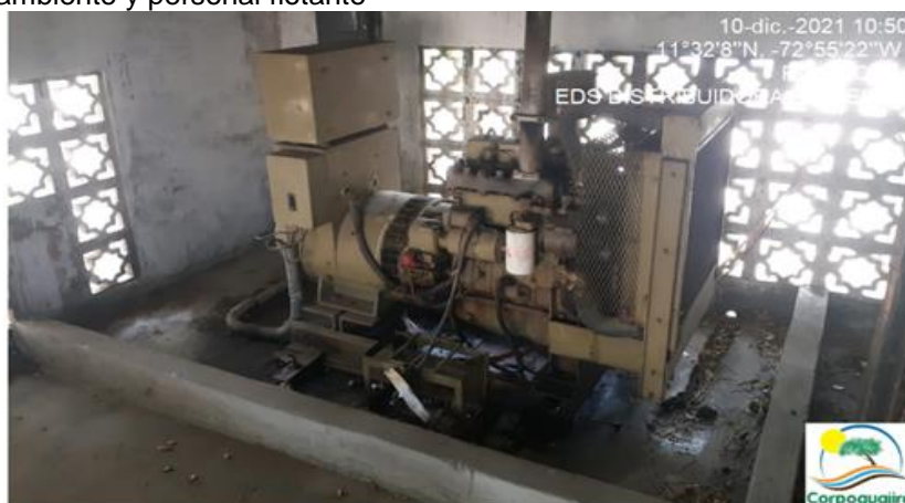
Fotografía No.10 Planta eléctrica. EDS AUTOCENTRO MÓBIL BALLENAS. 10 de diciembre de 2021.

3.2.5 CONTROL DE RUIDO: De acuerdo a lo observado en la visita, es posible se genere ruido intermitente derivado del funcionamiento o puesta en marcha de la planta eléctrica que posee el establecimiento. En el seguimiento no se logró percibir la intensidad de ruido que emite dicha planta cuando se encuentra encendida, de tal manera que se tenga percepción de posible afectación al ambiente y personal flotante