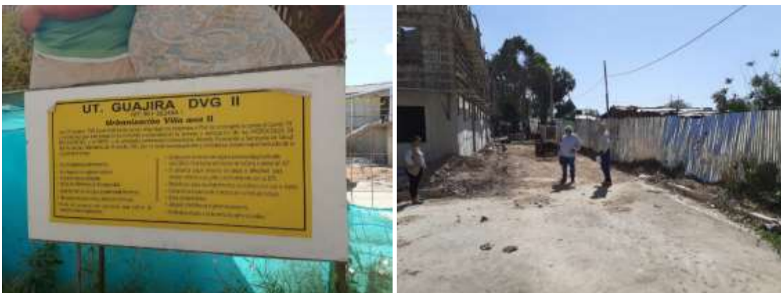
Img. (1 – 2). Villa Ana II proyecto de vivienda – lugar donde se encontraban los arboles.