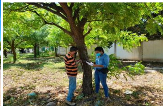
Revisión de parametros