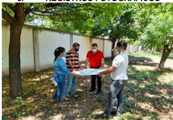
Análisis de la ubicación del proyecto con respecto a los arboles