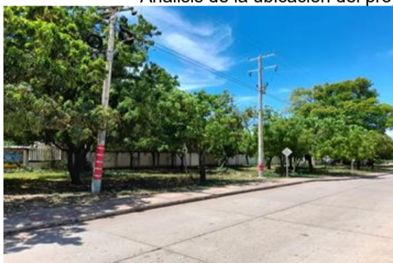
Panoramica del área