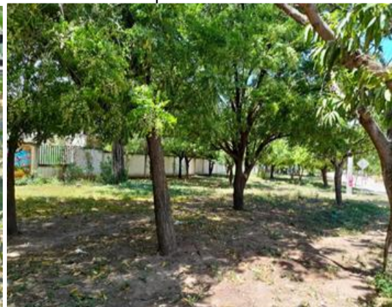
Panoramica del área