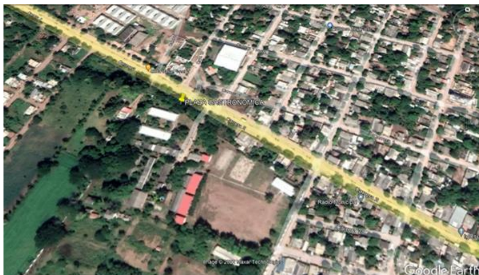
Fig.2. Ubicación satelital zona de interés.