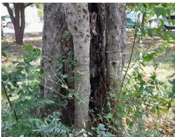
Árbol con cavidad