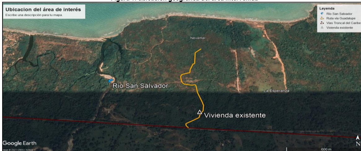
Figura 1: ubicación geográfica del área intervenida

encuentra un pequeño cauce de invierno que no fue alterado significativamente en su estructura hidráulica, de igual forma se dejaron intencionalmente los árboles grandes en las márgenes de la vía en todo el recorrido de 1.4 Km aproximadamente ver tabla y grafica 1 donde se muestra la ubicación geográfica del sitio de interés se muestran las coordenadas de los sitios visitados y la ubicación geográfica del área de interés.