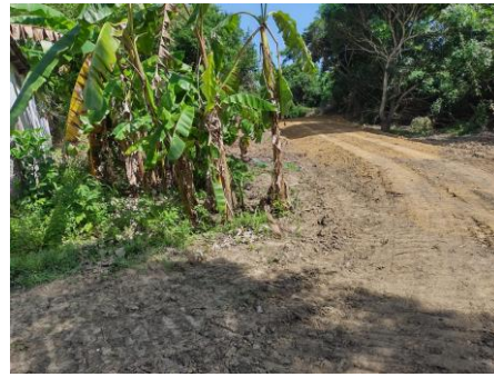
Fotografía 5. Y 6. Amplitud de la vía interna