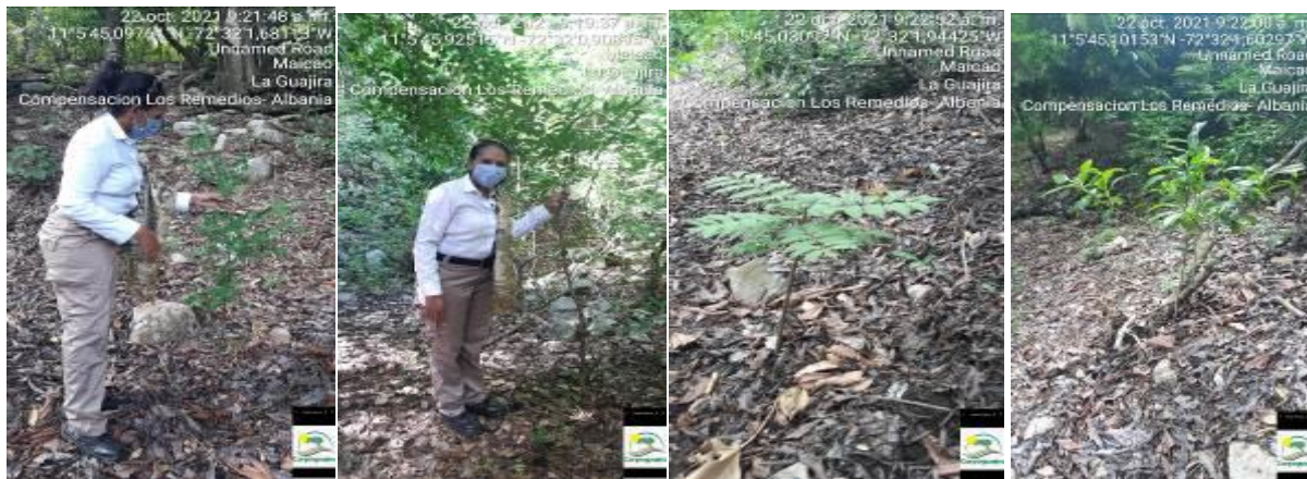
Fotografías: 9 - 12: Estado de las plantas sembradas arroyo Los Remedios

✚ Algunas plántulas sembradas muestran un adecuado desarrollo, mientras que otras no sobrevivieron.