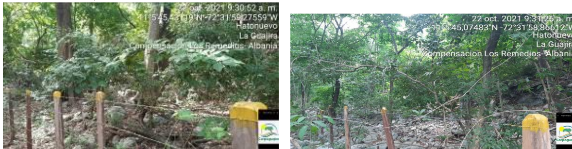
Fotografías: 7,8 Vista actual del estado del aislamiento ribera arroyo Los Remedios (Fuente, Corpoguajira, octubre 2021)

✚ Se verifico que el aislamiento se encuentra en buen estados