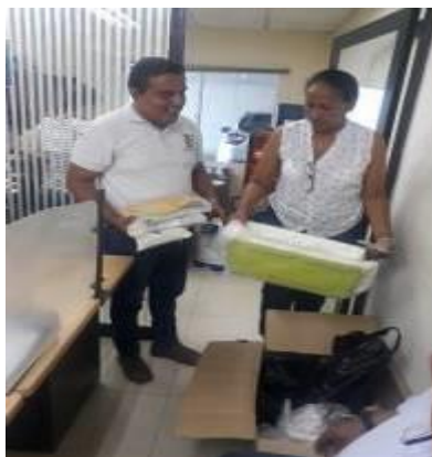
Fotografía 1,2: Evidencia entrega de elementos en la oficina de Almacén de CORPOGUAJIRA