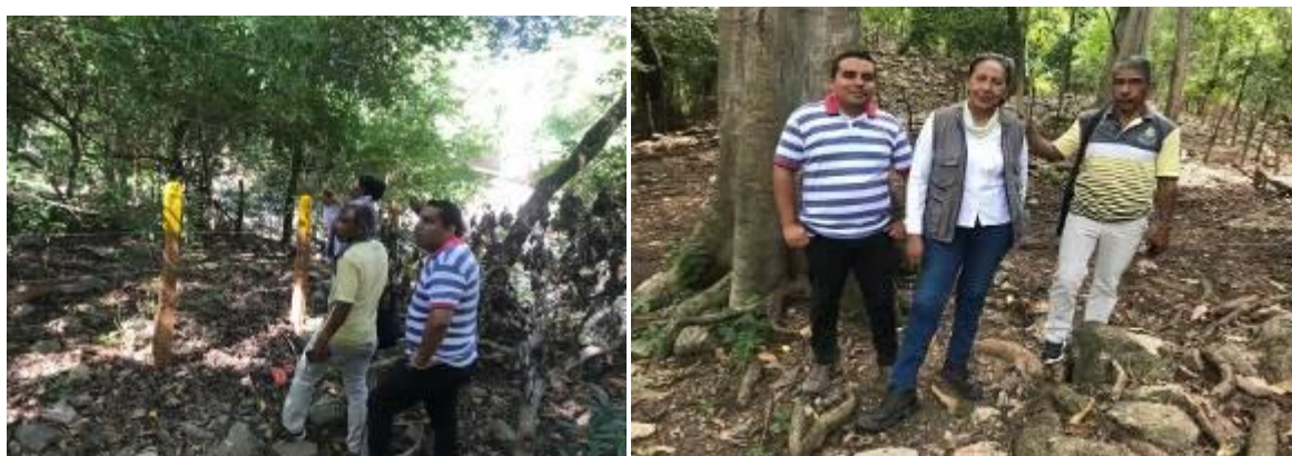
Fotografías.5,6: Visita de verificación y entrega del área reforestada (Fuente, Corpoguajira, Noviembre /2019)

Debido a la pandemia mundial generada por el COVID 19, en la vigencia 2020, no fue posible realizar la visita de seguimiento a la plantación establecida en compensación mediante la Resolución N°01267 del 14 de junio de 2016, para