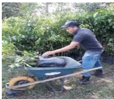
Fotografía 3,4: evidencia de la entrega del material vegetal