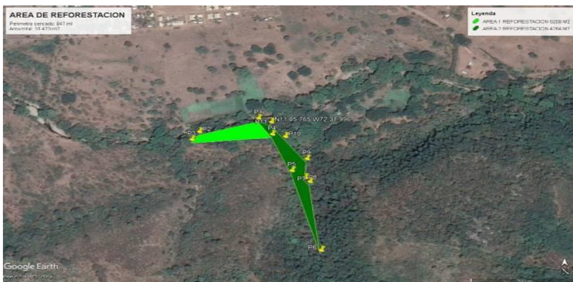
Imagen 1: área reforestada Microcuenca y/o Arroyo Tabaco, Corregimiento de los Remedios

Las labores de reforestación se coordinaron con los vigías ambientales de montes de oca, fundación reconocida por la autoridad ambiental del departamento Corpoguajira.