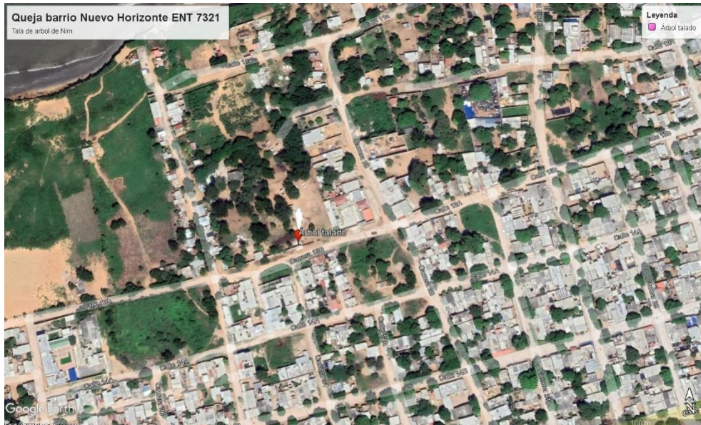
Horizonte, Municipio de Riohacha, La Guajira)