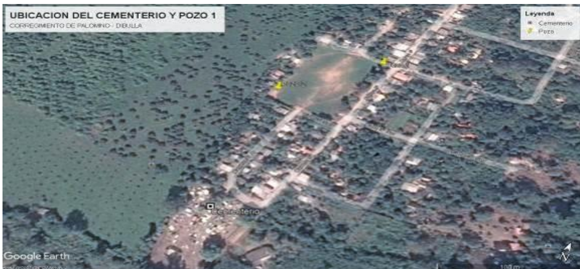
Imagen 2. Ubicación del cementerio con respecto al pozo 1 – Corregimiento de Palomino

3.3.2 A menos de 40 metros del pozo y a un lado de la cancha de futbol se observó mala disposición de residuos sólidos. (bolsas y recipientes plásticos), los cuales no son resultado de la construcción del pozo 1.