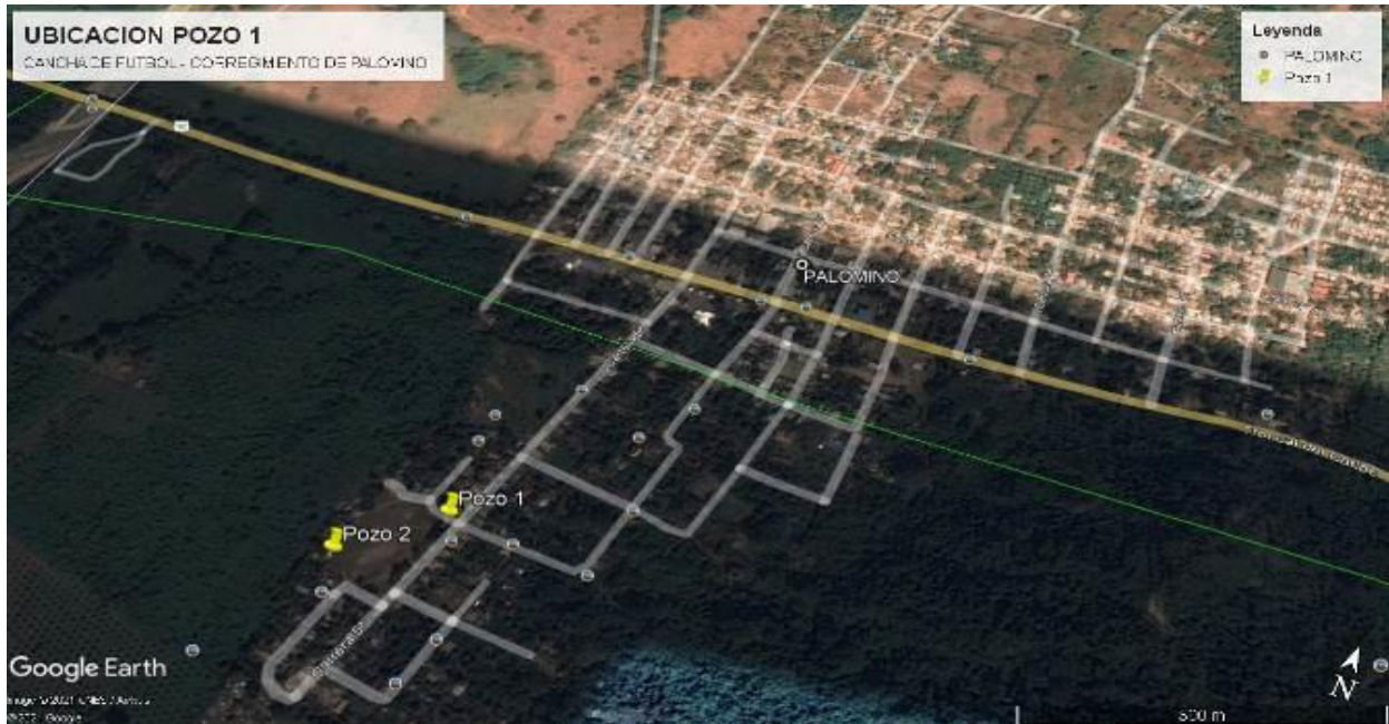
Imagen 1. Ubicación del pozo 1 – Corregimiento de Palomino

El pozo para la fecha de la visita, no poseía sistema de bombeo ni sistema eléctrico, contaba con una tapa metálica atomillada en la tubería de revestimiento a fin de evitar que personas ajenas al proyecto introduzcan material dentro del pozo y también para evitar accidentes. Este pozo fue construido en las coordenadas geográficas (sistema Magna Sirgas): Latitud 11°14'26.5" N; Longitud 73°33' 40.6"W.