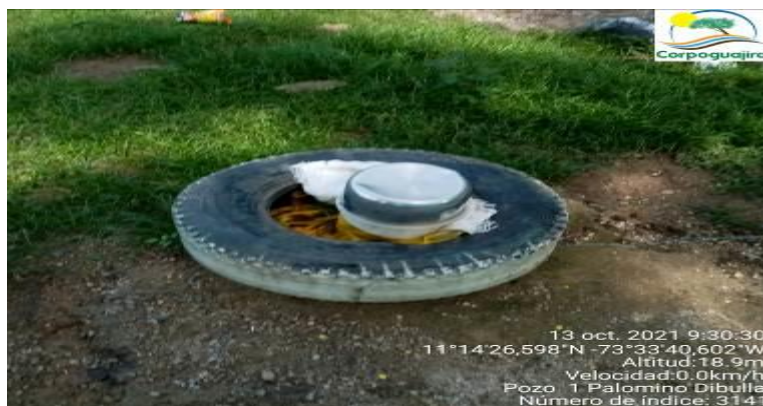
Fotografías 1 y 2. Estado actual del pozo No. 1