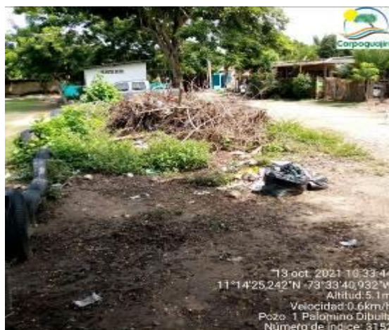
Fotografía 3. Residuos sólidos ordinarios a un lado de la cancha de Futbol

3.3.2 A menos de 40 metros del pozo y a un lado de la cancha de futbol se observó mala disposición de residuos sólidos. (bolsas y recipientes plásticos), los cuales no son resultado de la construcción del pozo 1.