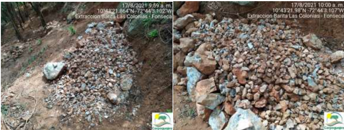
Fotografías No. 09 y 10. Mineral de Barita extraído de forma ilegal. 17 de agosto de 2021..