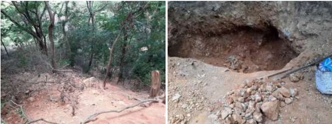
Fotografías No. 03 y 04. Extracción de Barita, creación de socavones en el terreno y tala de árboles. 09 de agosto de 2021. (Fuente: Corpoguajira 2021).

Evidencias fotográficas tomada el día 17 de agosto de 2021 por un profesional de Corpoguajira en la zona donde se viene realizando la actividad ilegal de extracción de Barita.