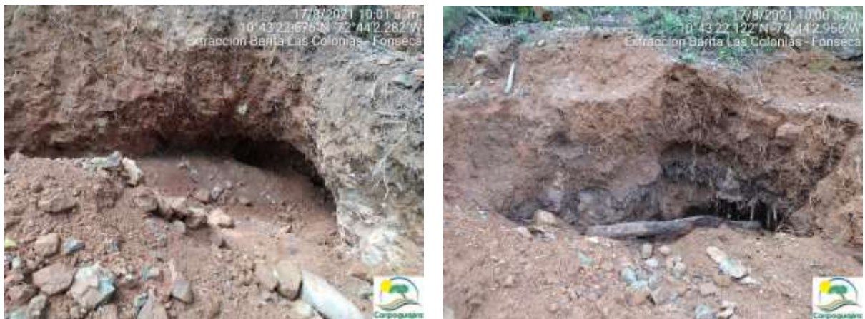
Fotografías No. 05 y 06. Extracción de Barita, creación de socavones en el terreno. 17 de agosto de 2021. (Fuente: Corpoguajira 2021).

Evidencias fotográficas tomada el día 17 de agosto de 2021 por un profesional de Corpoguajira en la zona donde se viene realizando la actividad ilegal de extracción de Barita.