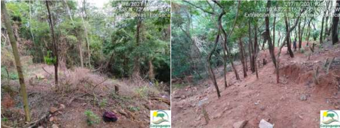
Fotografías No. 07 y 08. Tala de árboles para la extracción ilegal de Barita. 17 de agosto de 2021.