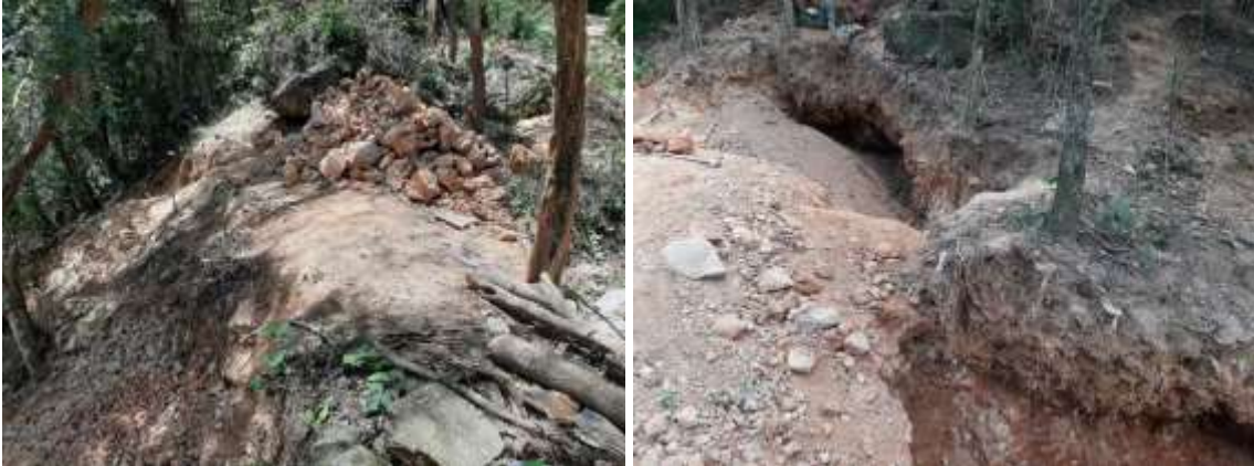
Fotografías No. 01 y 02. Extracción de Barita, creación de socavones en el terreno. 09 de agosto de 2021.

Evidencias fotográficas tomada el día 09 de agosto de 2021 por un profesional de Corpoguajira en la zona donde se viene realizando la actividad ilegal de extracción de Barita.