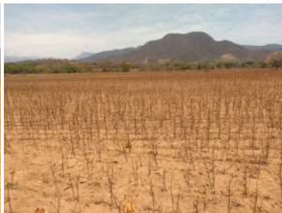
Actividades agropecuarias al interior del predio