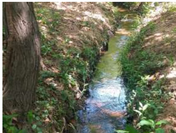
Conducción en terreno natural del recurso hídrico derivado de la corriente de uso público