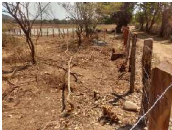
Reservorio de agua al interior del predio