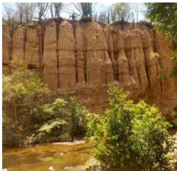
Sector sobre el río César de donde se deriva el recurso hídrico