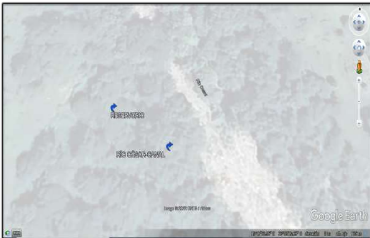
SITIOS DE INTERES