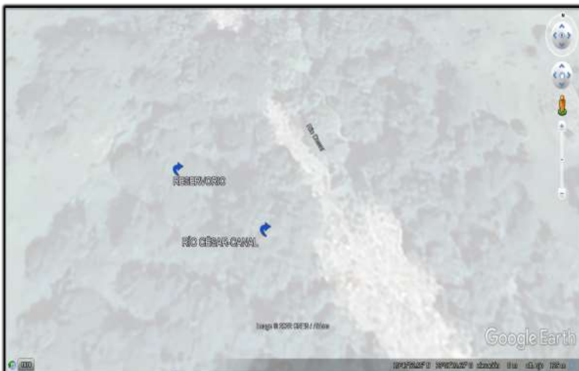
SITIOS DE INTERES